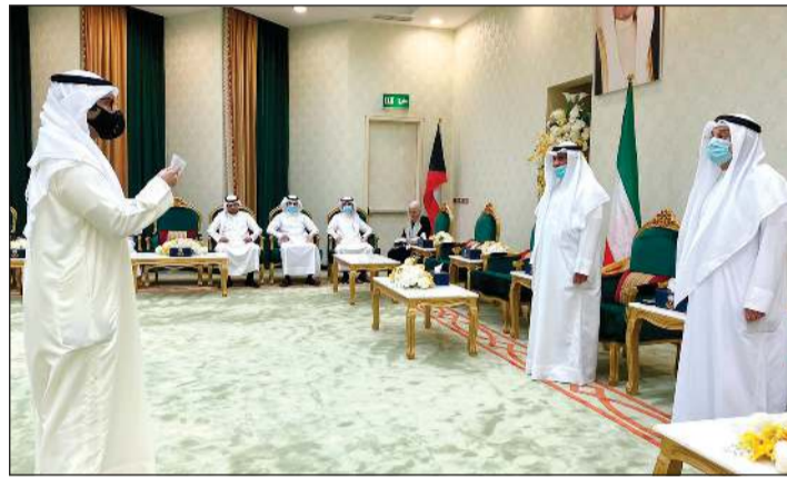
جانب من حلف اليمين

أدى اليمين القانونية صباح أمس أمام رئيس المجلس الأعلى للقضاء المستشار محمد جاسم بن ناجي والنائب العام المستشار ضرار علي العسوسي عدد 82 باحثاً مبتدئاً قانونياً، وذلك بمناسبة انتقالهم للعمل بوظيفة وكيل نيابة (ج) بالنيابة العامة، وذلك بموجب القرار الوزاري 2020/2019 الصادر بتاريخ 11 من صفر 1442 هجرية الموافق 2019/9/28.