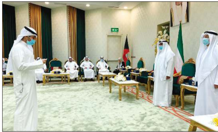
أحد الباحثين خلال أداء اليمين