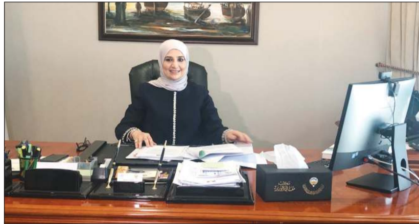
مريم العقيل خلال الاجتماع

كشفت وزيرة الشؤون الاجتماعية ووزيرة الدولة للشؤون الاقتصادية مريم العقيل ان الاجتماع السابق لوزراء العمل بدول التعاون الخليجي في هذا الجانب حيث وقعت الشهر الماضي على اتفاقية بين منظمة الهجرة والبرنامح الإنمائي للأمم المتحدة مع الامانة العامة للتخطيط والهيئة العامة للقوى العاملة. وأشارت العقيل الى ان الوزراء اتفقوا على ان يتم تطبيق الاستراتيجية في دول مجلس التعاون وفق قوانينها وانظمتها وان تكون هناك آلية واضحة من اولوياتها تشجيع الشباب الوطني على العمل داخل القطاع الخاص، التي جانب وضع آلية واضحة للاستقدام من الخارج، وحرصت الكويت على تفعيل هذه الخطوة من خلال الاتفاقية او المبادرة التي وقعت الشهر الماضي. وكشفت العقيل عن وضع