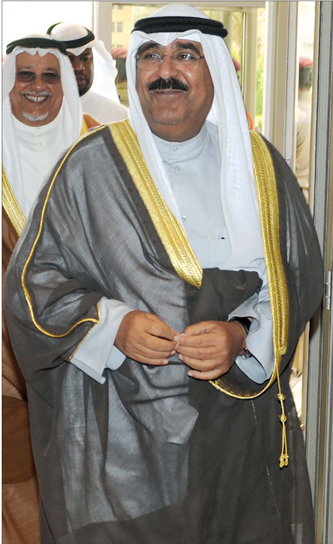
سمو ولي العهد الشيخ مشعل الأحمد