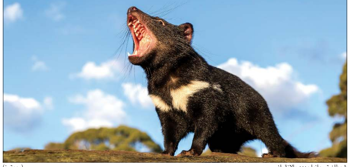
شياطين تسمانيا مهدد بالانقراض

تاز في مسلسل الرسوم المتحركة (لوني تونز). وكان المختل الأسترالي كريس هيمسورث وزوجته الممثلة السا باتاكي قد انضما إلى مجموعات حماية البيئة الشهر الماضي لإطلاق 11 من شياطين تسمانيا في محمية للحياة البرية بولاية نيو ساوث ويلز، على أن يتم إطلاق المزيد منها فيما بعد. وقال تيم فوكنر رئيس جمعية أوسي أرك المدافعة عن البيئة إن هذه هي «المرة الأولى منذ 3000 عام أو نحو ذلك التي تجوب فيها شياطين تسمانيا غابات البر الرئيسي». وعكفت جمعية أوسي أرك، التي تعاونت في هذا المشروع مع جمعيات أخرى منها جلوبال وايلدايف كونزرفيشن ووايلد أرك، على تربية صغار شياطين تسمانيا وتعترم إطلاق 20 حيوانا آخر منها العام المقبل.