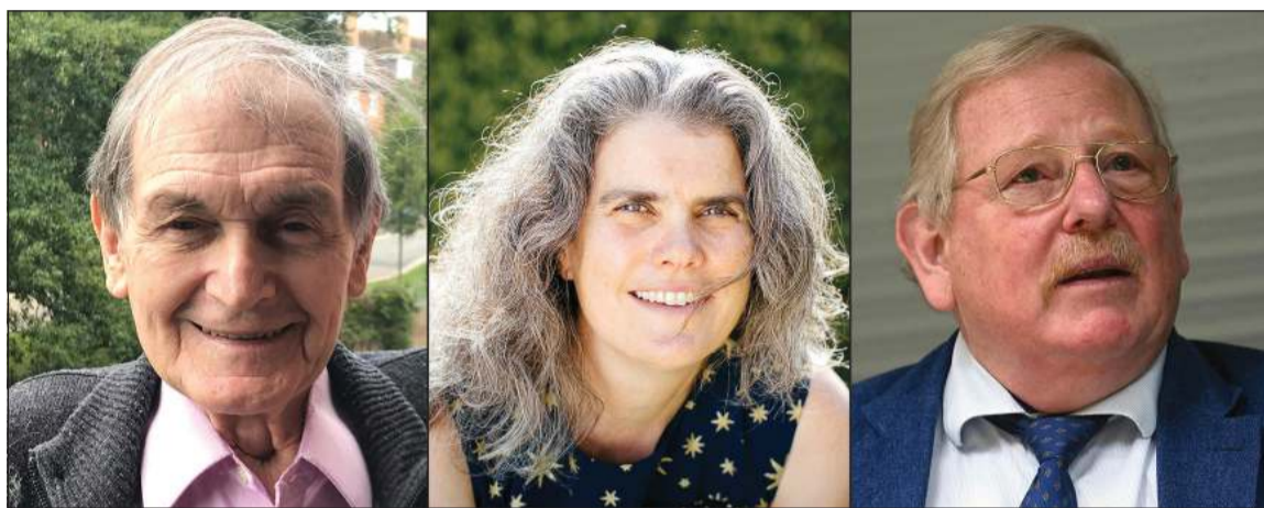
الألماني راينهارد غنزل والأميركية أندريا غيز تقاسما نصف الجائزة والبريطاني روجر بنروز حصل على النصف الآخر

وبما أنها غير مرئية، فمن الغير الممكن رؤيتها إلا بواسطة التباين، من خلال مراقبة الظواهر التي تخبرها في محيطها القريب. وشكل تطورا ثوريا في مجال الفيزياء الفلكية، وكان الخبراء يرجحون إعطاء جائزة نوبل هذه السنة لاكتشاف يتعلق بالفيزياء الفلكية أو فيزياء الكم، وهما تركزان على درس عالم الظواهر الفائقة الصغر. وكانت الجائزة منحت العام الفائت لثلاثة علماء كونييات هم: الأميركي الكندي جيمس بيبلز والسويسريان ميشال مايور وديديه كلو لمساهماتهم في اكتشافات نظرية في علم الكونيات الفيزيائي وفي فهم خبايا الكون واكتشاف كوكب خارج المجموعة الشمسية.