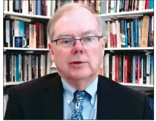
البروفيسور روبرت دينغويل

يأتي الخريف ثم الشتاء، بما يحملانه من أوبئة موسمية مثل الزكام والأنفلونزا، في تزامن مع انتشار فيروس كورونا الذي لا يزال مستعصيا على العلاج والمناعة. لكن بعض العلماء يراهن على نشوب حرب داخلية بين الفيروسات، حسب صحيفة «الإنديبننت»، البروفيسور روبرت دينغويل من جامعة توتنغهام ترنت بشير الي بارقة أمل تخفف من القلق حول تزامن ظهور الأنفلونزا مع كوفيد-19 خلال شتاء هذا العام. فهو يتعشم في احتمال نشوب صراع تنافسي بين الفيروسات، كونها تصيب نفس الجهاز التنفسي بما قد يجعلها تخوض حربا على النفوذ تنتهي عادة باستبعاد الأطراف الأضعف. يقول البروفيسور: «لا أحد يفهم تماما هذه المنافسة ولكنها لوحظت في الماضي بين الأنفلونزا وفيروسات أخرى، وكان الفوز للأنفلونزا». فلنتعشم ان تنتصر الأنفلونزا مرة أخرى، لا أن تتحالف مع الفيروس الجديد.