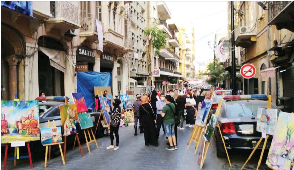
جمعية الفنانين اللبنانيين للرسم والنحت خلال افتتاح معرض النهوض الثامن في الجيمزة (محمود الطويل)

وتابع: حزب الله رفض عودتي إلى مصرف لبنان