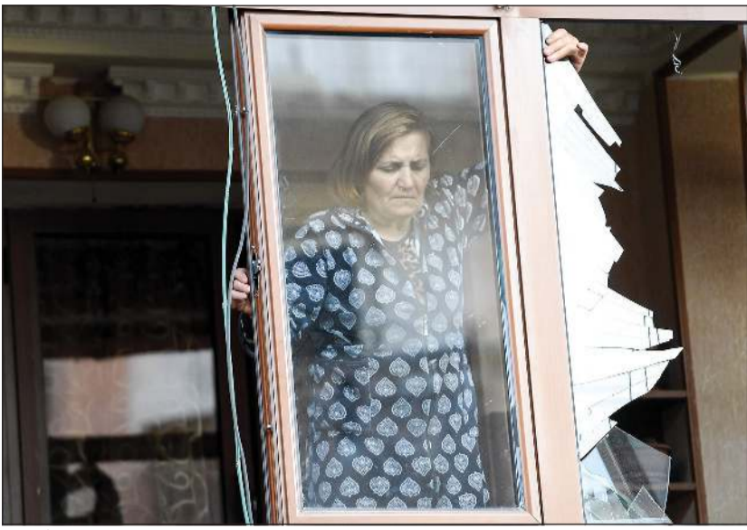
ارمينية تصلح زجاج منزلها المتضرر جراء القصف الأذربيجاني

وأعرب المشاركون في مجموعة «مينسك» عن قلقهم إزاء الأنباء عن الأعداد المتزايدة من الضحايا بين المدنيين، مشددين على أن اختيار مدنيين كهدف عسكري وتعرض السكان المحليين للخطر بعد أمرا غير مقبول إطلاقا مهما كانت الظروف. ودعوا طرفي النزاع إلى الوفاء التام