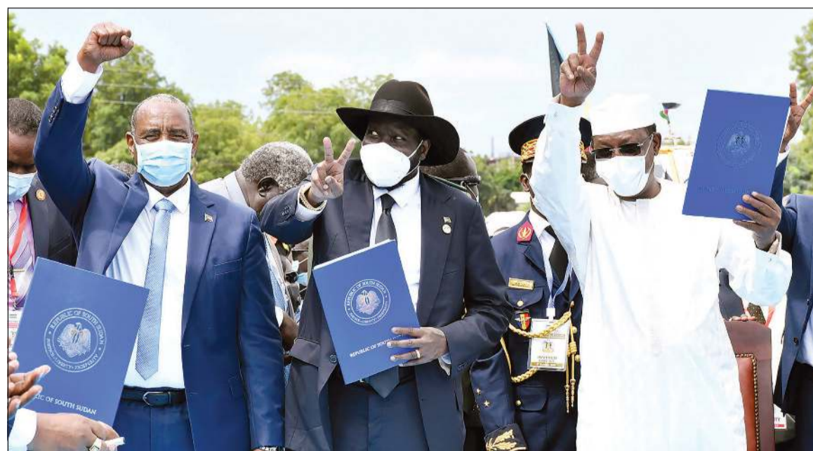
رئيس مجلس السيادة السوداني الفريق عبدالفتاح البرهان ورئيس جنوب السودان سيلفا كير ورئيس تشاد إدريس ديبي يلوحون بنسخ من اتفاق السلام عقب توقيعهم في جوبا أمس

عواصم - وكالات: وقعت الحكومة السودانية والمتمردون أمس اتفاق سلام تاريخيا يهدف إلى إنهاء عقود من الحرب قتل فيها مئات الآلاف من الأشخاص. ووقع ممثلون للحكومة السودانية الانتقالية والمتمردين الاتفاق خلال مراسم أقيمت في جوبا عاصمة جنوب السودان، وسط أجواء احتفالية تخللها التصفيق والزغاريد والهتاف.