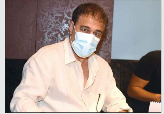
النجم إبراهيم الحربي