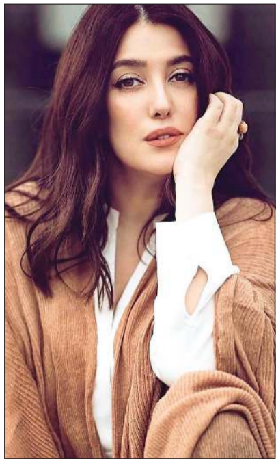
القاهرة: خالد أبوالمجد

تعود الفنانة كندة علوش بعد غيابها 3 سنوات عن الساحة الفنية للدراما التلفزيونية من خلال سلسلة حلقات «ضي القمر» الذي يتكون من 10 حلقات ضمن «إلانا» التي بدأ عرضها منذ فترة ونالت إقبالا في مشاهدتها من الجمهور. وتجسد كندة شخصية «الشفيا» التي تمر علاقتها الزوجية مع زوجها بالكثير من الضغوطات بسبب رغبتها في الإنجاب وصعوبة تحقيق ذلك ما يعرضها لكثير من المشاكل الاجتماعية التي يتناولها العمل. وقصة «ضي القمر» تأليف يسري الفخراني وعبر سليمان وإخراج أحمد حسن، ويشارك في البطولة كل من: محمد علاء، محمد شاهين، زينب غريب، محمود العمروسي، أحمد عبدالله محمود، مروة عيد، ريهام محيي وباسمين موافي. كما تستعد كندة علوش في الفترة الحالية لبطولة فيلم «بلالين» ويشاركها البطولة الفنانون: أحمد كمال، سوسن بدر، علا رشدي ومصطفى خاطر، وهو من إخراج معتز التوني، وتأليف عادل صليب.