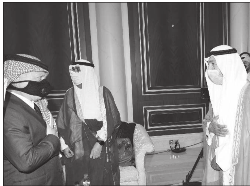
العامل الأردني يقدم العزاء للشيخ مشعل الأحمد والشيخ جابر العبدالله

للتقديم واجب العزاء في وفاة فقيد الوطن المغفور له بإذن الله تعالى صاحب السمو الأمير الراحل الشيخ صباح الأحمد، طيب الله ثراه وجعل الجنة مأواه. وقد