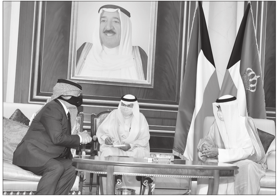
صاحب السمو الأمير الشيخ نواف الأحمد خلال استقباله العامل الأردني الملك عبدالله الثاني

الأردن دعا إلى إقامة صلاة الغائب على روح سمو الأمير الراحل اليوم