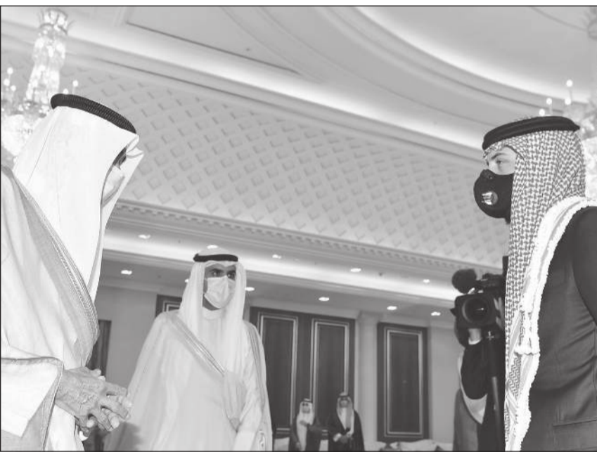
صاحب السمو الأمير الشيخ نواف الأحمد يتلقى العزاء من ولي عهد الأردن صاحب السمو الملكي الأمير الحسين بن عبدالله الثاني

وكان الأردن أعلن إقامة صلاة الغائب على روح المغفور له أمير البلاد الراحل الشيخ صباح الأحمد بعد صلاة الجمعة المقبلة مباشرة. جاء ذلك خلال تعميم صادر عن وزارة الأوقاف والشؤون والمقدسات الإسلامية الأردنية لمديري مديريات الأوقاف وخطباء المساجد لإقامة صلاة الغائب على روح «فقيد العالمين العربي والإسلامي».