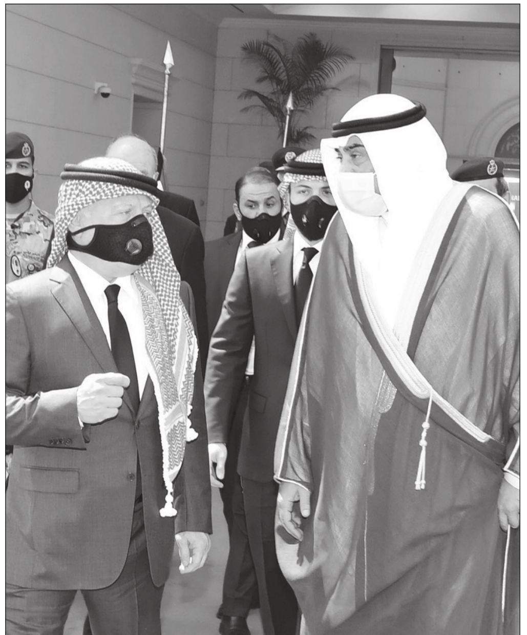
سمو الشيخ صباح الخالد في استقباله العامل الأردني