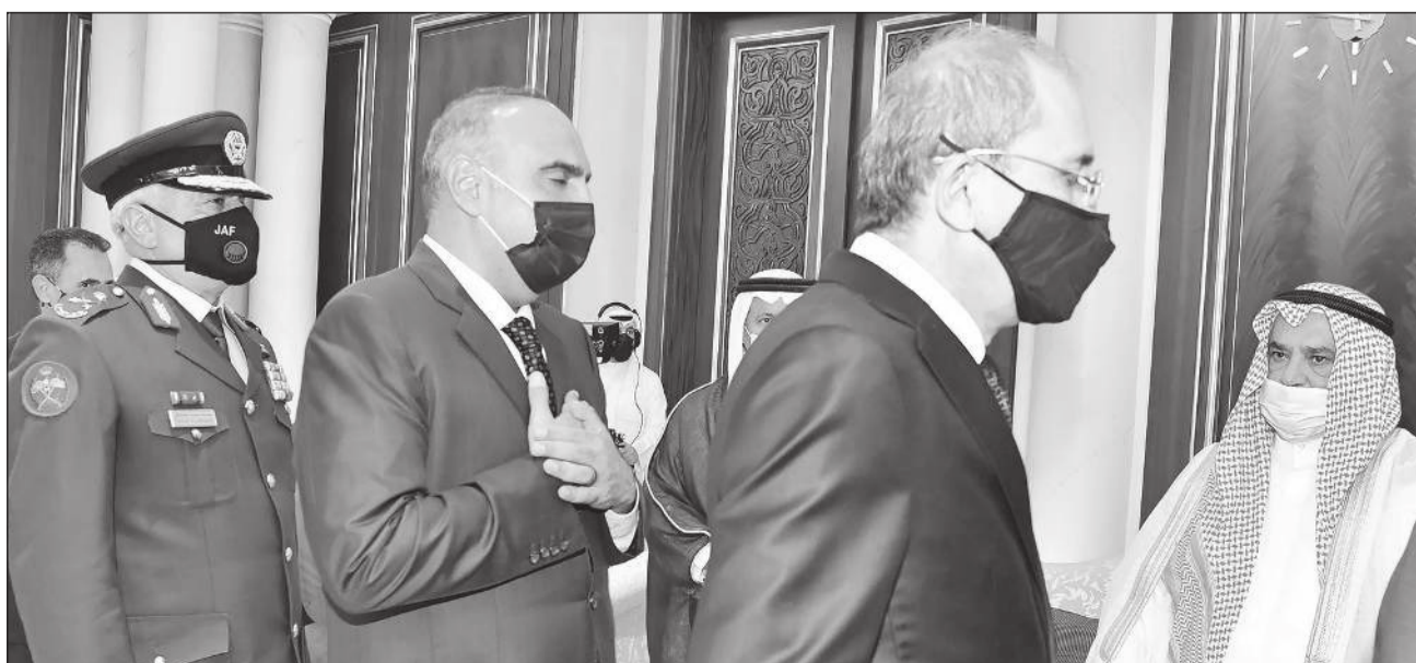
الشيخ حمد صباح الأحمد يتلقى العزاء من الوفد الأردني