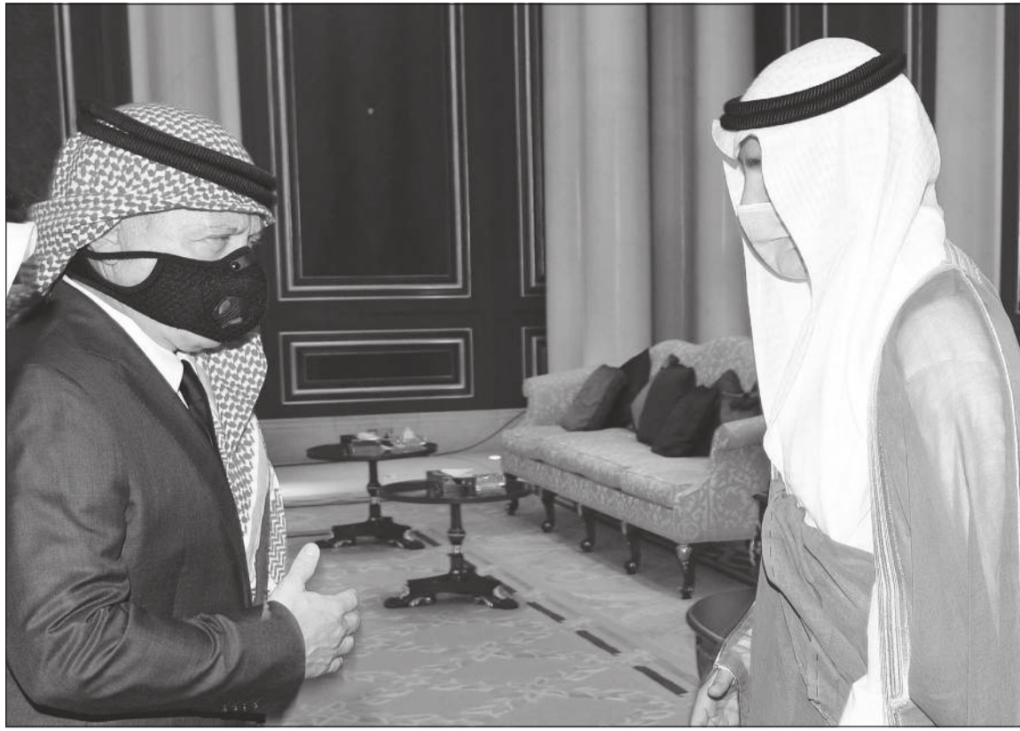
العامل الأردني الملك عبدالله الثاني يقدم العزاء لرئيس مجلس الأمة مرزوق الغانم