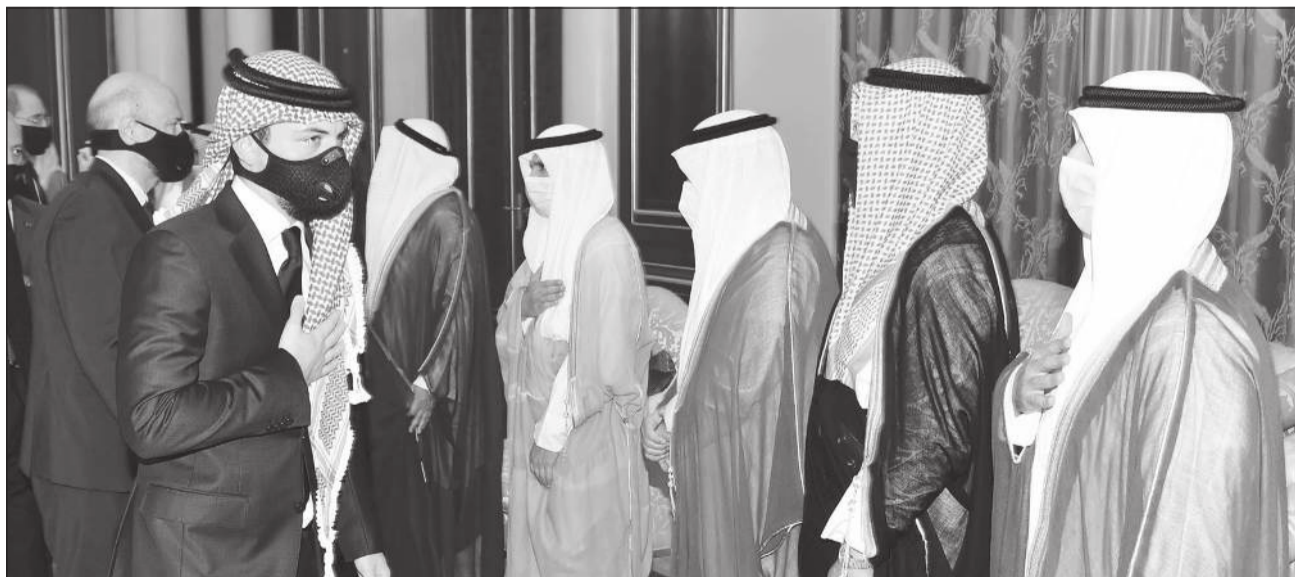
ولي عهد الأردن صاحب السمو الملكي الأمير الحسين بن عبدالله الثاني خلال تقديم واجب العزاء

استقبال صاحب السمو الأمير الشيخ نواف الأحمد - حفظه الله ورعاه - في المطار الأميري ظهر أمس صاحب الجلالة الهاشمية الملك عبدالله الثاني بن الحسين ملك المملكة الأردنية الهاشمية الشقيقة وصاحب السمو الملكي الأمير الحسين بن عبدالله الثاني ولي العهد والوفد المرافق له، حيث قام جلالته بتقديم واجب العزاء في وفاة فقيد الوطن المغفور له بإذن الله تعالى صاحب السمو الأمير الراحل الشيخ صباح الأحمد، طيب الله ثراه وجعل الجنة مأواه. كما قدم جلالته التعازي إلى رئيس مجلس الأمة مرزوق الغانم والشيخ مشعل الأحمد نائب رئيس الحرس الوطني والشيخ جابر العبدالله وسمو الشيخ ناصر المحمد وسمو الشيخ جابر المبارك وسمو الشيخ صباح الخالد رئيس مجلس الوزراء وعدد