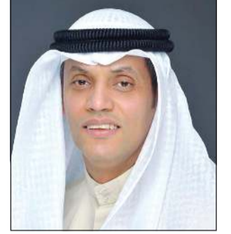
د. محمد بوزير

يحلّ الأمين العام بالإقامة في الهيئة العامة لمكافحة الفساد (نزاهة) د.محمد بوزير ضيفاً على «ألو الأنباء» اليوم الثلاثاء من الساعة الـ 6 حتى الـ 7 مساءً، وذلك للرد على أسئلة القراء، والحديث عن اختصاصات الهيئة والقضايا المحالة الى جهات الاختصاص ومشروع قانون تنظيم حق الاطلاع على المعلومات وفي حال دخوله حيز التنفيذ ومدى انعكاساته على تعزيز الشفافية، وغيرها من الامور التي تكون ضمن اختصاصات الهيئة. يمكن لقراءنا الكرام التواصل مع د.محمد بوزير على الهاتف: 22272890.