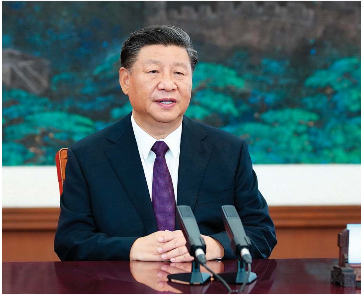
الرئيس الصيني شي جينبنغ يخاطب زعماء العالم

وقد ألمح وانغ تينغ يي، الخبير الصيني بقسم العلاقات الدولية في جامعة تسينغهاو، أن