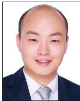
وانغ تينغ يي

وشدد على أن مفهوم «مجتمع ذي مستقبل مشترك للبشرية» يؤكد السعي وراء المصالح والقيم المشتركة للبشرية، ويعزز التنمية المشتركة لجميع البلدان في السعي لتحقيق تنميتها الذاتية، وأصبحت أهمية هذا المفهوم أكثر وضوحا الآن.