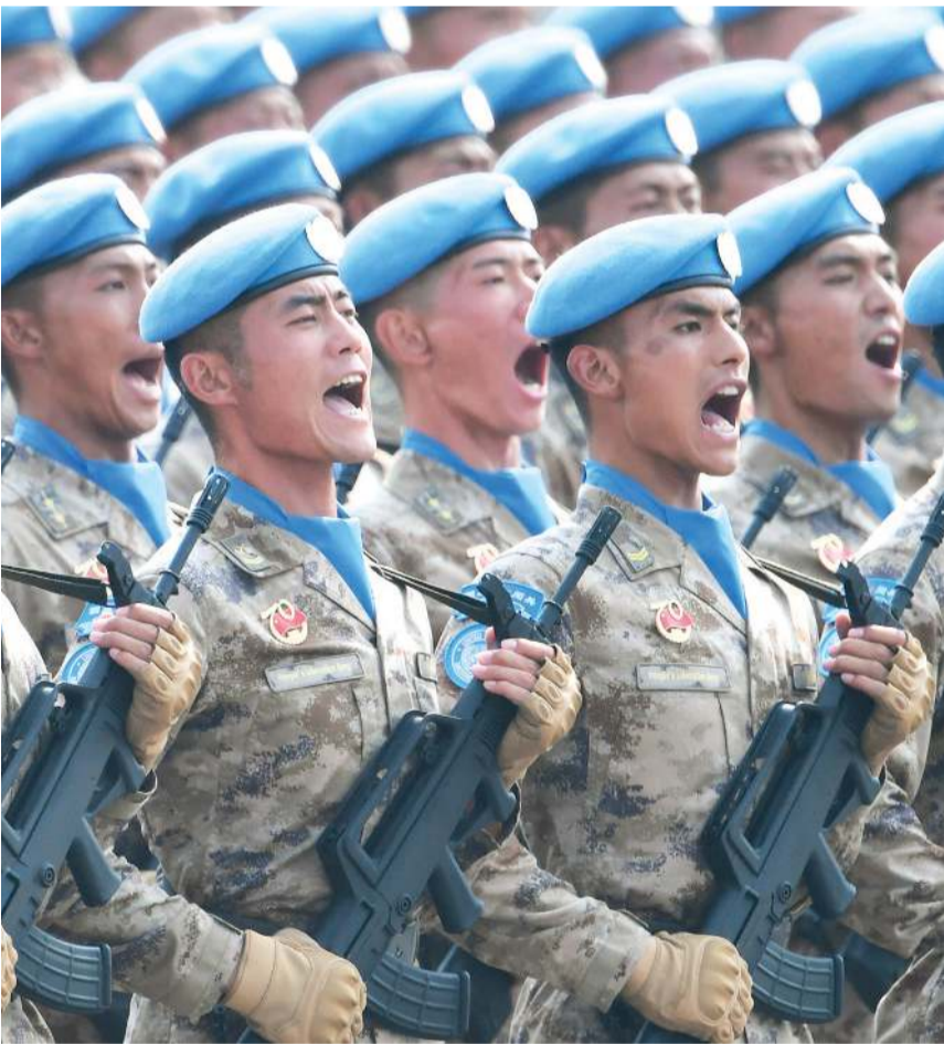
تشكيل من قوات حفظ السلام الصينية يشارك في عرض عسكري كبير أقيم احتفالاً بالذكرى الـ 70 لتأسيس جمهورية الصين الشعبية في العاصمة الصينية بكين أول أكتوبر 2019