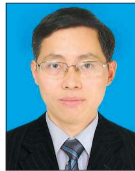
سون ده قانغ