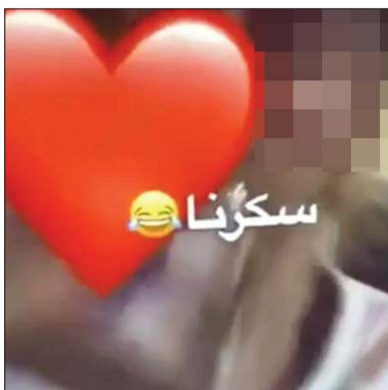
من المقطع المتداول