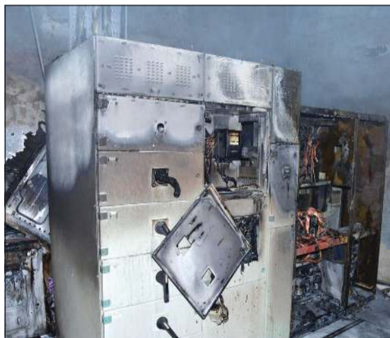
المحول وقد لحقت به تلفيات جسيمة