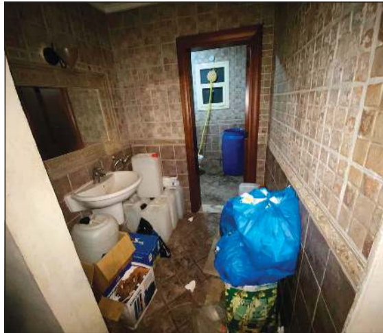
من مصنع الخمر الذي بدأ مقاماً داخل قبلا من طابقين