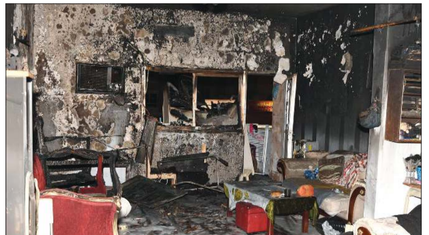
حريق «صباح السالم»، التهم محتويات الشقة

قام رجال الإطفاء بإخلاء العمارة من السكان وتمت مكافحة الحريق وإخماده، وقد أسفر الحادث عن إصابة أربعة أشخاص من سكان العمارة بالاختناق وتمت معالجتهم في موقع الحادث. وجار التحقيق من قبل مراقبة تحقيق الحوادث لمعرفة أسباب الحادث، وتواجد في موقع الحادث رجال الداخلية وفرق الطوارئ الطبية.