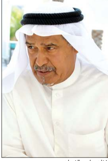
الفنان جاسم النبهان