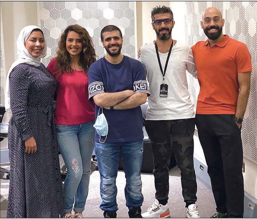
فريق برنامج «ساعة معاكم» في الاستوديو