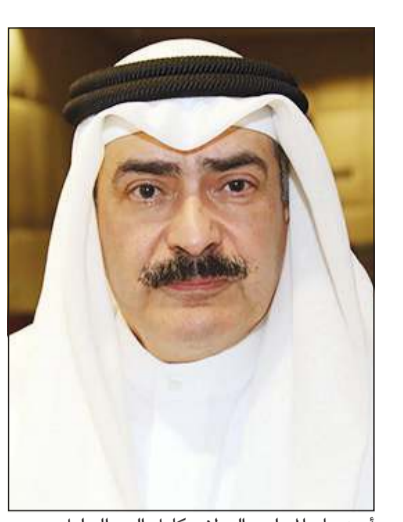
أمين عام المجلس الوطني كامل العبدالجليل