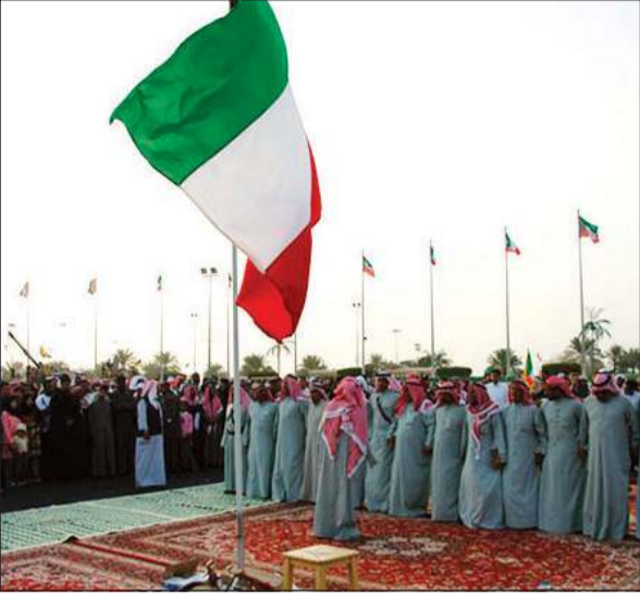
فرقة أولاد عامر الشعبية خلال إحدى المناسبات الوطنية