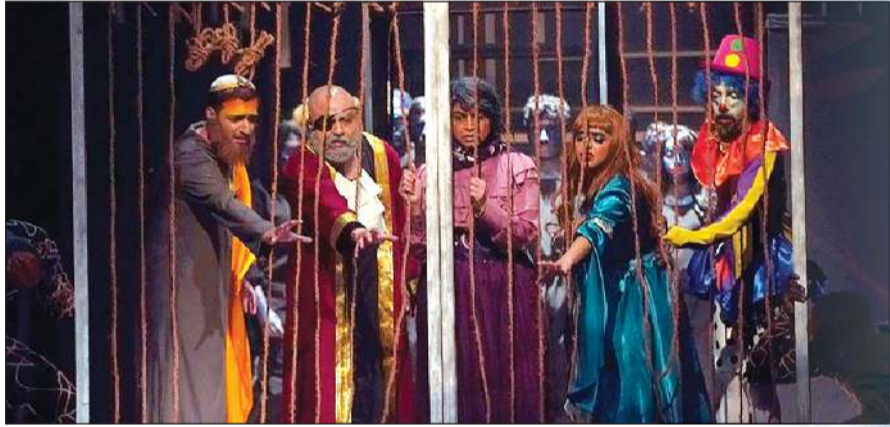
مسرحية عثمان الشطى «أين عقلي يا قلب» التي اكتسحت جوائز المهرجان في البحرين العام الماضي