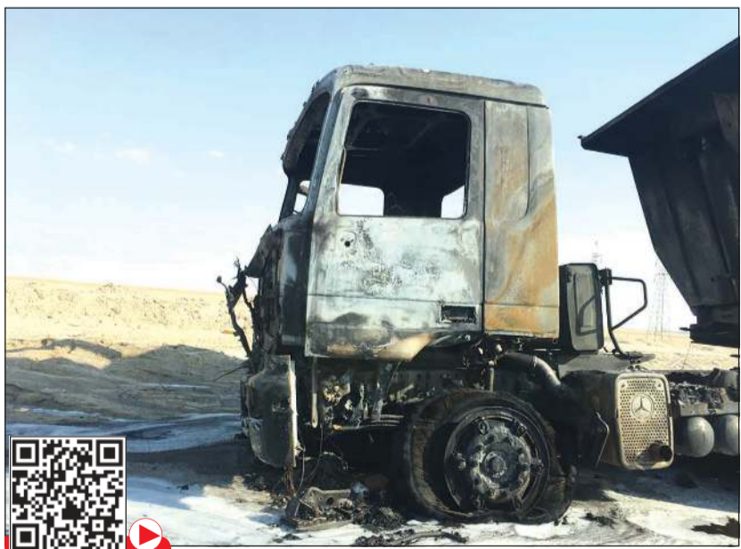
الشاحنة وقد لحقت بها تلفيات بالغة

تمكنوا من إخماد ألسنة اللهب دون إصابات، وفور انتهاء الحريق والسيطرة عليه تم فحص المركبة من قبل رجال الإطفاء وتبين لهم أن الحريق سببه تماس كهربائي.