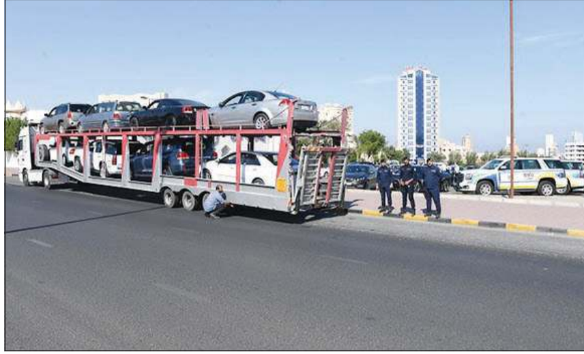
صورة أرشيفية لمركبات مخالفة في طريقها إلى طريق الحجز

وأحداث يقودون سيارات من دون رخصة سوق، وفي الفروانية تم تحرير 2900 مخالفة، وفي الاحدي تم تسجيل 3201 مخالفة وإحالة 7، وفي الجهراء تم تحرير 2942 مخالفة، وفي مبارك الكبير حرر رجال المرور 828، أما سرية المهام الخاصة التابعة للمرور فحررت 79