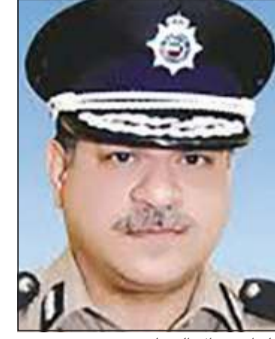
الواء جمال الصايغ

عاودت أعداد المخالفات المرورية إلى الارتفاع مجدداً عقب أسابيع من الانخفاض الناتج عن الحظر الكلي الجزئي، حيث سجل قطاع المرور الأسبوع الماضي، برئاسة وكيل وزارة الداخلية المساعد لشؤون العمليات والمرور اللواء جمال الصايغ، نحو 25 ألف مخالفة في محافظات الكويت الست، فيما احتلت العاصمة الصدارة بالنسبة لعدد المخالفات المسجلة، وبحسب مصدر أمني، فإن المخالفات المسجلة في محافظة العاصمة بلغت 5528، فيما حررت إدارة العمليات في المرور 5250 وحجزت 5 مركبات وأحالت 3 مخالفين للنظر. وفي حوالي، تم تحرير 3272 وضبط 4 مطلوبين و4