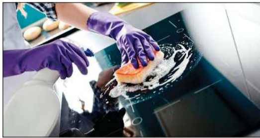
الهوس بالنظافة يتأرجح بين العادة الشخصية والمرض النفسي

منه كما لو انهم يستمعون الى اسطوانة عالقة لا تتوقف عن تكرار المقطع ذاته. لا يوجد حتى الآن تفسير لسبب الهوس القهري، فبعض الدراسات تشير الى عوامل وراثية، بينما توجد دلائل على تأثير أنواع معينة من البكتيريا تسبب خللاً عصبياً محضاً، لكن ما يزال المرض يخضع للاختبارات والتجارب التي توصي بالعلاج بعقاقير طبية.