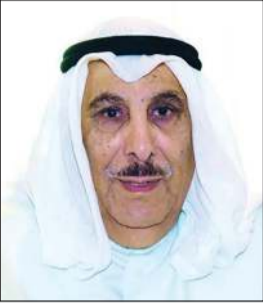
شعر: علي يوسف المزروع

كيف تبدو الحياة في ظل شعب زرع المفسدون فيه الفساد تعب المصلحون يبذون نصحاً بينما المفسدون زادوا امتدادا كبرث أطمع الفساد فراحت تتمادي بما تخطى البلادا ايها الشعب لا تكُنْ لا مبال وارفع الصوت همةً واجتهاداً وارتقي سلم المناذرة واهتف كل ما تم نهبه أن يعادا