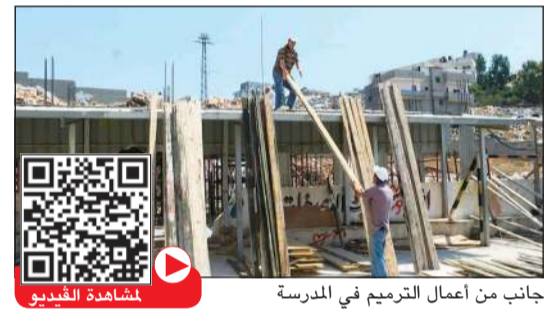
جانب من أعمال الترميم في المدرسة