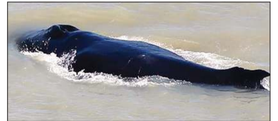
أحد الحيتان لدى ظهوره بمياه النهر