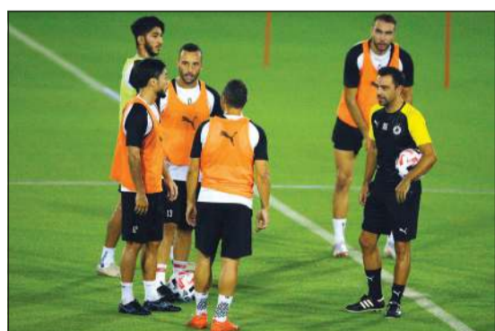
تشافني يقود تدريبات السد القطري

وقد استقبلت الدوحة خلال اليومين الماضيين 13 فريقاً بعد أن اعتذر فريق الوحدة الإماراتي عن الحضور بسبب إصابة عدد من لاعبيه بفيروس كورونا.