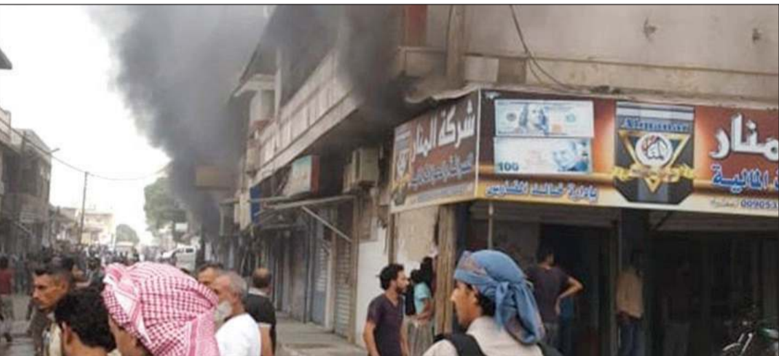
صورة تداولها ناشطون لأحد تفجيرات رأس العين

(د.ب.أ) تفجير سيارة مفخخة قرب شركة كهرباء المبروكة جنوب غرب مدينة رأس العين بعد ضبطها. ولقت القائد العسكري إلى ان جميع السيارات والدراجات النارية المفخخة وقادمة مناطق سيطرة قوات سورية الديمقراطية (قسد) الأكراد أو النظام.