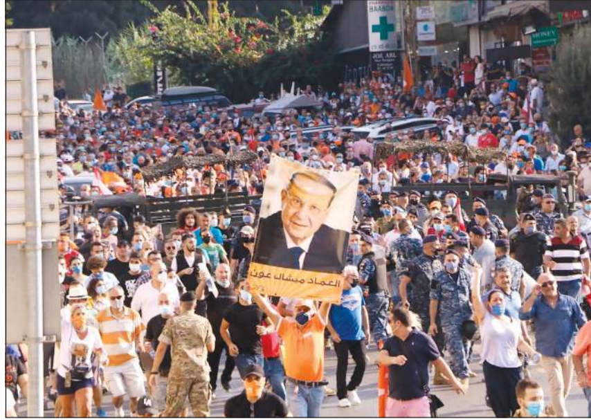
.. وبالمقابل مناصرو التيار الوطني الحر خلال التجمع على طريق قصر بعبدا دعما لرئيس الجمهورية ميشال عون