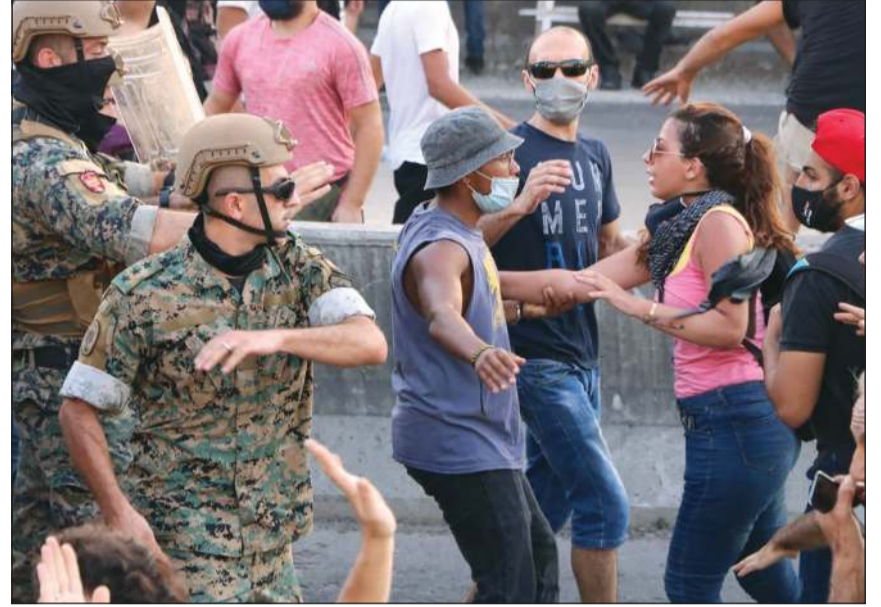
اشتباكات بين المتظاهرين ضد رئيس الجمهورية وقوات الجيش على طريق بعبدا

مبلا للتشدد في تمسكه بحقيبة وزارة المال لحركة أمل، أو للتسوية تحديدا، وان كل ما هو خارج وزارة المال يمكن التغامه عليه»، وقال بري لصحيفة «النهار» البيروتية «مستعد أن أقدم للرئيس المكلف من واحد الى 10 أسماء، وأكثر حتى يقبل بواحد منها، وإذا رفض الاسم أريد توضيحا للرفض، فأعطي اسما آخر والى ما شاء الله»، وأضاف «أنا مع حكومة اختصاصيين 100٪، وبالحد الأدنى من النكبة السياسية، لا نريدهم حزبيين ولا قرييين من حزبين، ولكن لا نريد ان يسقطوا علينا وهم ممن يعيشون في الخارج ولا علم لهم بما هي عليه البلاد، أنا اعطي الاسم، والا عبنا يحاولون، أو فليشكلوها من دون شيعة، اذا كانوا قادرين على ذلك».