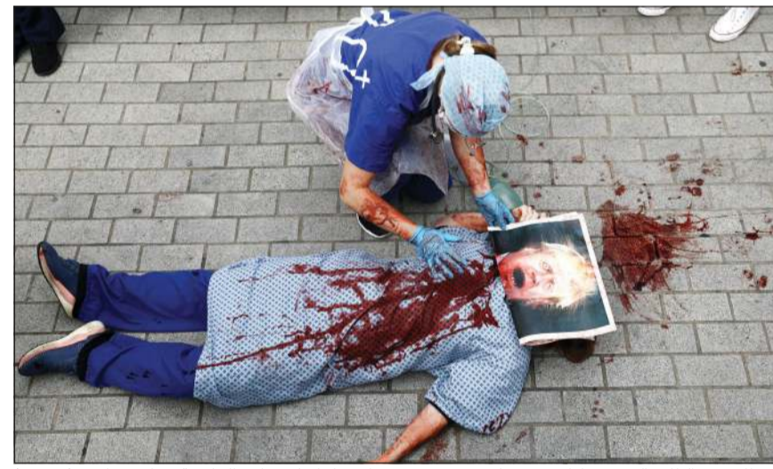
مظاهر من الطاقم الصحي يبلغ صورة ليوريس جونسون احتجاجا على تعامل الحكومة مع كورونا

لكن وزارة الصحة الروسية أعلنت عن بدء توزيع أول دفعة من اللقاح الروسي «سبوتنيك v»، ضد فيروس كورونا على الأقاليم الروسية. وأشارت الوزارة إلى أنه خلال توزيع الدفعة الأولى سيتم