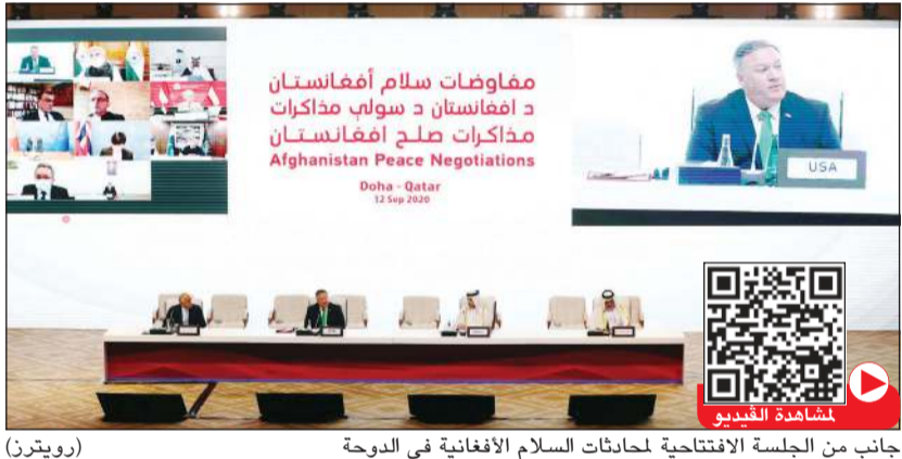
جانب من الجلسة الافتتاحية لمحادثات السلام الأفغانية في الدوحة

الإرهابية بما فيها تنظيم القاعدة) وألا تسمح لهم باستخدام الأراضي الأفغانية للتدريب والتحصين لعملياتها وكذلك بالتزامات الحكومة الأفغانية بالالتصاف للولايات المتحدة التي تصير قاعدة للإرهاب الدولي الذي يهدد العالم بأسره.