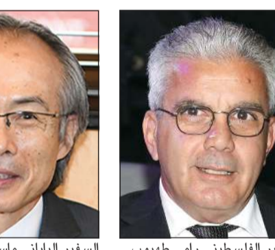
السفير الفلسطيني رامي مطهورب

في جميع مشارق الأرض ومغاربها، فلا تكاد تمر أزمة على أي من الدول إلا وتجد الكويت وشعبها كما تحمي فلسطين وشعبها وقضيتها. من جانبه، هنا سفير أوكرانيا لدى البلاد د.أليكساندر بالانوتسا صاحب السمو الأمير الشيخ صباح الأحمد بمناسبة الذكرى السادسة لتكريم الأمم المتحدة لسموه «قائداً للعمل الإنساني» والكويت «مركزاً للعمل الإنساني»، كما توجّه بالتهنئة إلى سمو نائب الأمير وولي العهد الشيخ نواف الأحمد، وإلى سمو رئيس الوزراء الشيخ صباح الخالد، وإلى شعب الكويت الصديق بهذه المناسبة المشرفة.