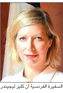
السفيرة الفرنسية آن كلير ليجيندر

تصل السفيرة الفرنسية الجديدة آن كلير ليجيندر يوم الأربعاء 16 الجاري إلى الكويت خلفاً لسابقها ماري ماسبيوي. وتعتبر السفيرة الجديدة من جيل الشباب من الدبلوماسيين، حيث تبلغ من العمر 41 عاماً، الذين تحول عليهم «الخارجية الفرنسية» في تعزيز العلاقات مع الدول الصديقة. آن كلير ليجيندر معروفة بحيويتها ونشاطها، حيث كانت أول امرأة تشغل منصب القنصل العام لفرنسا في الولايات المتحدة منذ عام 2016. وتمتلك السفيرة الجديدة أدوات مهمة ومهارات متميزة، حيث تتقن اللغة العربية بشكل مثير فني وخبرة معهد باريس للدراسات السياسية، وجامعة السوربون نوفيل.