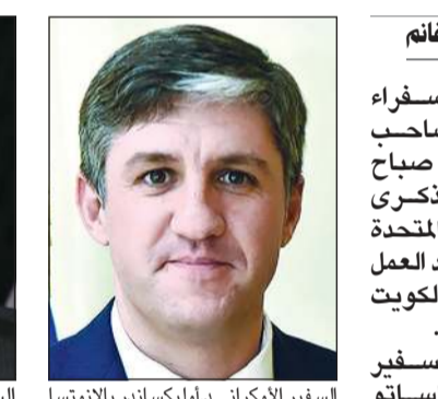
السفير الأوكراني د.أليكساندر بالانوتسا

وان فلسطين قيادة وشعباً ستبقى الشقيق المخلص والأمين للكويت وستحتمي الكويت وشعبها كما تحمي فلسطين وشعبها وقضيتها. من جانبه، هنا سفير أوكرانيا لدى البلاد د.أليكساندر بالانوتسا صاحب السمو الأمير الشيخ صباح الأحمد بمناسبة الذكرى السادسة لتكريم الأمم المتحدة لسموه «قائداً للعمل الإنساني» والكويت «مركزاً للعمل الإنساني»، كما توجّه بالتهنئة إلى سمو نائب الأمير وولي العهد الشيخ نواف الأحمد، وإلى سمو رئيس الوزراء الشيخ صباح الخالد، وإلى شعب الكويت الصديق بهذه المناسبة المشرفة.