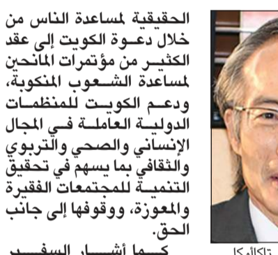
السفير الياباني ماساتو تاكاوأكا

في جميع مشارق الأرض ومغاربها، فلا تكاد تمر أزمة على أي من الدول إلا وتجد الكويت وشعبها كما تحمي فلسطين وشعبها وقضيتها. من جانبه، هنا سفير أوكرانيا لدى البلاد د.أليكساندر بالانوتسا صاحب السمو الأمير الشيخ صباح الأحمد بمناسبة الذكرى السادسة لتكريم الأمم المتحدة لسموه «قائداً للعمل الإنساني» والكويت «مركزاً للعمل الإنساني»، كما توجّه بالتهنئة إلى سمو نائب الأمير وولي العهد الشيخ نواف الأحمد، وإلى سمو رئيس الوزراء الشيخ صباح الخالد، وإلى شعب الكويت الصديق بهذه المناسبة المشرفة.