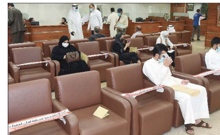
تطبيق التباعد الاجتماعي في صالة المراجعين