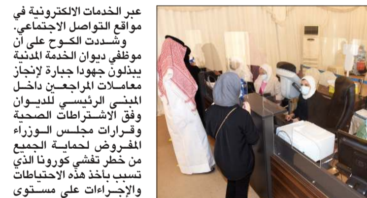
قاعة الانتظار الخارجية

وقالت في تصريح لـ «الأنباء» يتم تطبيق إجراءات التباعد الاجتماعي بترتيب كراسي الانتظار وتثبيت الحواجز الزجاجية الفاصلة بين الموظف والمراجع، ويتم استقبال المراجعين بأكية تضمن التباعد تماماً وعبر الحجز المسبق من خلال منصة متى الحكومية ووجود (باركود) بين نوع العاملة المراد إنجازها من قبل المراجع وذلك بهدف إنجاز المعاملات بأسرع وقت ممكن دون أي تأخير من قبل الموظفين في كل «كاونتر» مخصص وتوفيرا لوقت وجهد المراجعين وحفاظاً على الصحة العامة للجميع. وقالت الكوچ ان ديوان الخدمة بدأ باستقبال المراجعين عبر منصة متى الحكومية خلال شهر أغسطس الماضي بعد حصول المراجع على (الباركود)