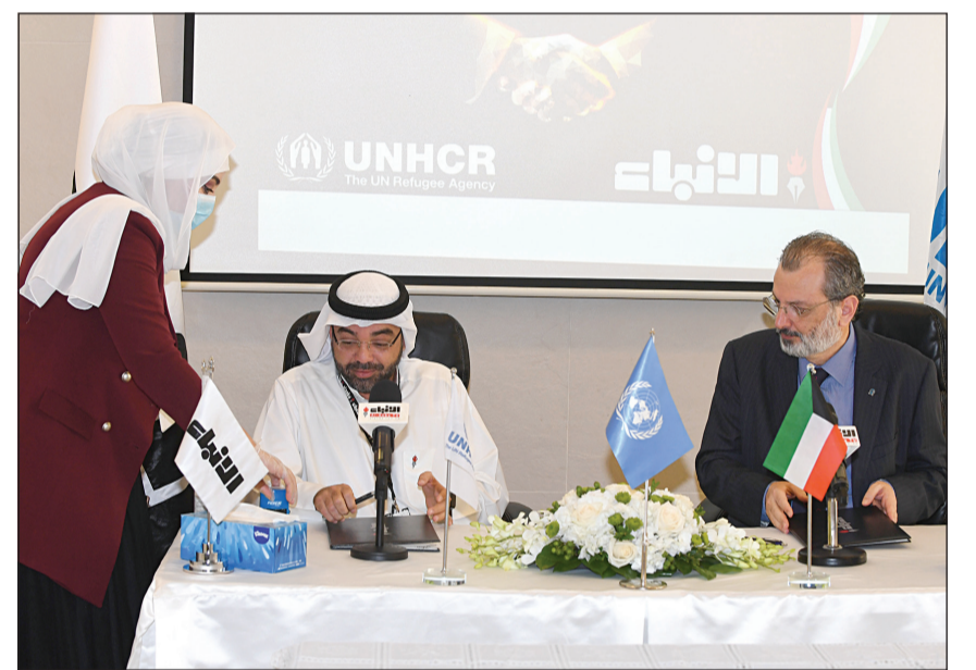
ختم أوراق الاتفاقية بعد التوقيع