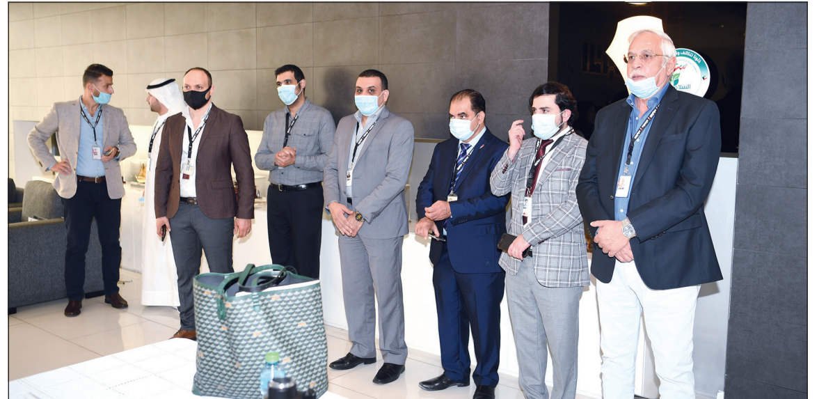
عدد من الزملاء خلال توقيع الاتفاقية