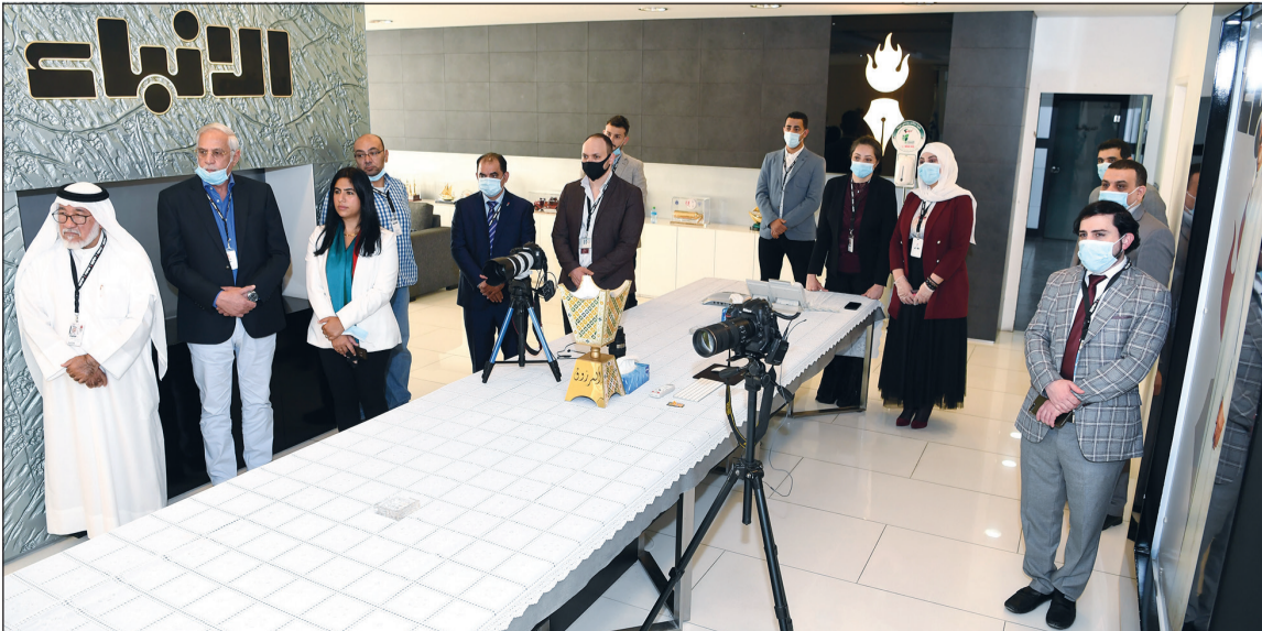
متابعة من الزملاء لتوقيع الاتفاقية بين «الأنباء» والمفوضية السامية للأمم المتحدة لشؤون اللاجئين في الكويت

وأضاف د.حدادين، في مجمل كلمته التي القاها خلال مراسم توقيع اتفاق التعاون بين مكتب المفوضية السامية للأمم المتحدة لشؤون اللاجئين في الكويت وجريدة «الأنباء»: إن المفوضية منفتحة على قطاع الإعلام الكويتي لما للكويت من أهمية وتقل على