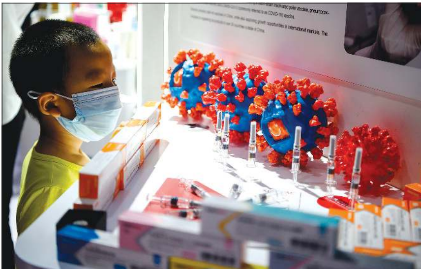
طفل يشاهد عينات من لقاح سينوفاك في معرض الصين التجاري في بكين أمس

ألفا بحسب إحصاء جامعة جونز هوبكنز. ومع تسجيلها أكثر من 6 ملايين ورعب المليون إصابة، وما يقارب الـ 190 ألف