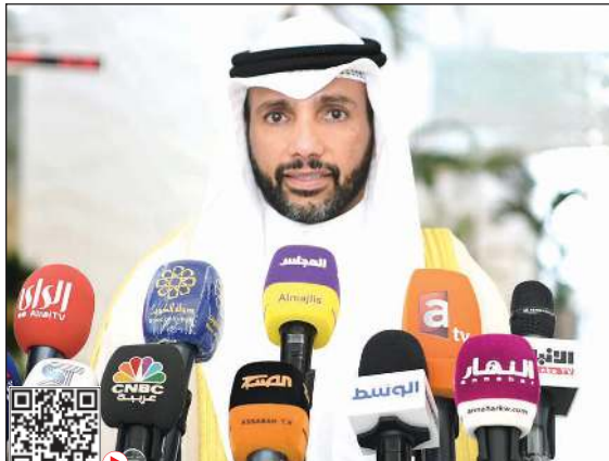
رئيس مجلس الأمة مرزوق الغانم متحدثا

المحاسبة وغيرها. وأضاف: إن لم ننته فسيرحل الجزء الذي لم ننته منه إلى جلسة الخميس بعد التصويت على طلبى طرح الثقة.