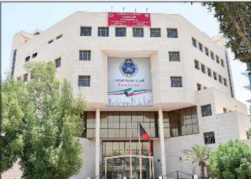
مبنى الإدارة العامة للإطفاء

ينقل أعضاء قوة الإطفاء بالإدارة العامة للإطفاء إلى قوة الإطفاء العام بذات أوضاعهم ودرجاتهم ومزاياهم الوظيفية للرتب المعادلة لدرجاتهم التي كانوا يشغلونها. كما يصدر الرئيس القرارات التي تتضمن شروط وقواعد السلامة الواجب توافرها في مختلف الأنشطة الصناعية والتجارية والزراعية والمهنية والحرفية والأعمال والمباني السكنية والمحلات والمنشآت بما يكفل حماية الأرواح والممتلكات العامة والخاصة،