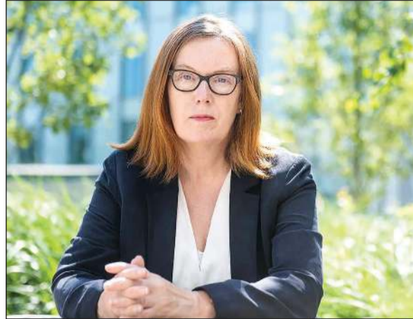
البروفيسورة سارة غيلبرت

مع أن الغموض لا يزال يكتنف أصل فيروس كورونا، يعتقد معظم الباحثين أنه بدأ في الخفايش قبل أن يقفز إلى الإنسان عن طريق حيوان آخر. وحسب صحيفة «انديبننت» فإن أويثة أخرى انتشرت في العالم أخيراً مثل «ايبولا» و«سارس» و«عرب النيل» كان مصدرها الحيوانات أيضاً وإن كان «كوفيد-19» قد أظهر أنه الأكثر قدرة على العدوى. لا أحد يعتقد أن القضاء على الحيوانات التي تشكل مصدراً للعدوى سيضع حداً لانتشار هذه الفيروسات. وما يهم الخبراء هو العوامل التي تجعل من هذه الحيوانات مصدراً للعدوى. وهنا تشير أصابع الاتهام ليس إلى الحيوانات بل إلى السلوك البشري في التعامل معها ومع بيئتها. من هؤلاء البروفيسورة سارة غيلبرت من جامعة وكسفورد التي تقود التجارب لصنع لقاح ضد