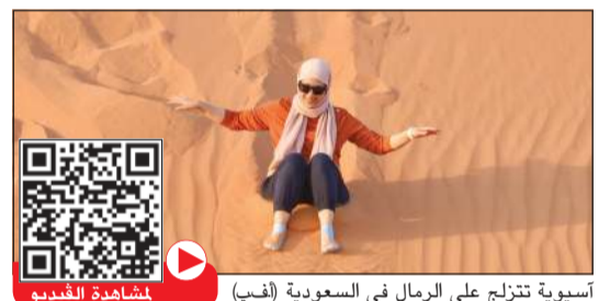
آسيوية تزلج على الرمال في السعودية