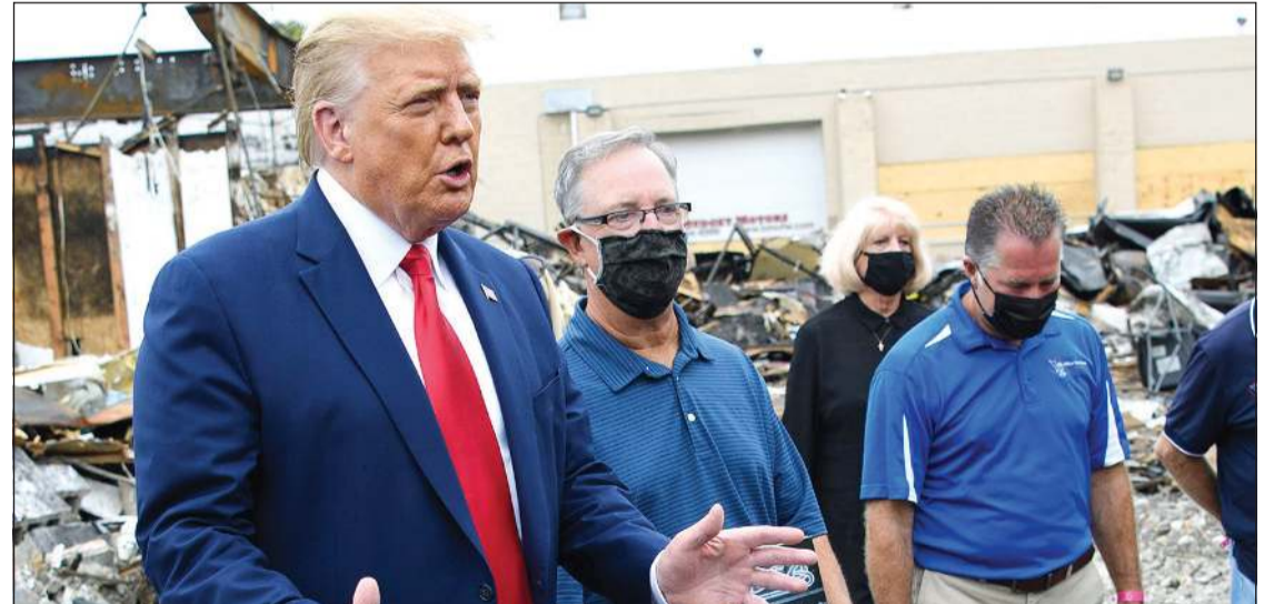
الرئيس الأميركي دونالد ترامب خلال زيارته لأحد المواقع التي تعرضت للتخريب نتيجة الاضطرابات في كينوشا بولاية ويسكونسن