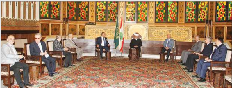
مفتي لبنان الشيخ عبد اللطيف دريان مستقبلا وفد نقابة الصحافة اللبنانية برئاسة النقيب عوني الكعكي

بيروت - خلدون نواص أكد مفتي لبنان الشيخ عبد اللطيف دريان أن تسمية الرئيس المكلف الدكتور مصطفى أديب لتشكيل حكومة هو فرصة وطنية للنهوض بلبنان الذي هو في وضع صعب للغاية ويتطلب مساعدة الجميع والتعاون معه لإنجاح مهمته، وشدد أمام وفد نقابة الصحافة اللبنانية برئاسة النقيب عوني الكعكي أن دار الفتوى إلى جانب الرئيس المكلف لتشكيل حكومة وطنية متجانسة في أسرع وقت ممكن للقيام بالإصلاحات المطلوبة ولتحقيق مطالب الناس وهذا ما يمتنا كل لبناني. ونقل النقيب الكعكي عن المفتي دريان فتاواه بأن نتجح هذه