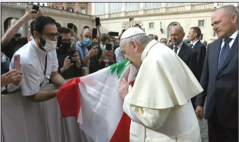
البابا فرنسيس يقبل العلم اللبناني في اول لقاء علني منذ فرض قيود العزل بسبب كورونا