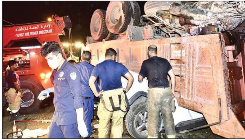
رجال الاطفاء خلال تعاملهم مع الحادث المروع