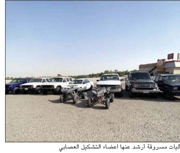
أليات مسروقة أرشد عنها اعضاء التشكيل العصابي

استعاد رجال الإدارة العامة للمباحث الجنائية 8 مركبات و2 بقي مبلغ عن سرقتها وذلك بعد القبض على تشكيل عصابي سداسي 5 مواطنين وبدون، فيما كشفت التحقيقات الأولية عن ان العصابة السداسية وراء ارتكاب ما لا يقل عن 50 قضية سرقة وسلب بالقوة باستخدام المركبات التي كانوا يقومون بسرقتها. كما قادت التحقيقات رجال المباحث الى مواقع ارتكاب العصابة