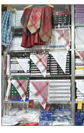
محل للملابس الشعبية

فقط وإنما للكويت بشكل عام. وأشار إلى أنه رغم قلة الخدمات في هذا السوق إلا أنه يشهد إقبالاً كبيراً لا مثيل له مقارنة مع الأسواق في محافظة الجهراء لشموليته ولتواجد الكثير من الأنشطة المختلفة التي يقصدها الناس لتلبية متطلباتهم.