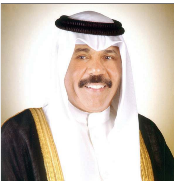
سمو نائب الأمير وولي العهد الشيخ نواف الأحمد

بعث سمو نائب الأمير وولي العهد الشيخ نواف الأحمد، حفظه الله، ببرقية تهنئة إلى الرئيس نجوين فو ترونغ رئيس جمهورية فيتنام الاشتراكية الصديقة عبر فيها سموه عن خالص تهناتي صاحب السمو الأمير الشيخ صباح الأحمد، حفظه الله ورعاه، وتهاني سموه بمناسبة العيد الوطني لبلاده، متمنيا سموه له موفور الصحة والعافية وللبلد الصديق كل الرقي والنماء. كما بعث سمو رئيس مجلس الوزراء الشيخ صباح الخالد ببرقية تهنئة مماثلة.