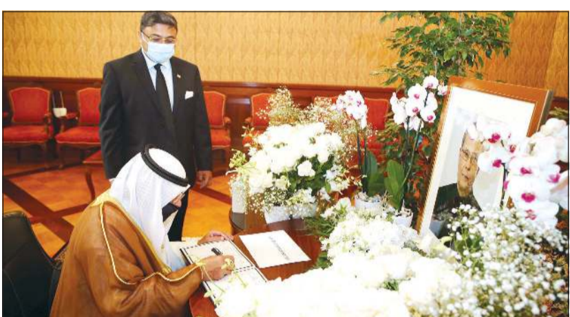
نائب وزير الخارجية خالد الجارالله خلال تقديم التعازي بوفاة رئيس جمهورية الهند السابق برناب موكهيري

قام نائب وزير الخارجية خالد الجارالله أمس بزيارة إلى سفارة جمهورية الهند لدى الكويت، وكان في استقباله سفير جمهورية الهند سيبجي جورج، حيث قدم التعازي فيها ببطء الفقد وعلاقاته بالعالم العربي ومواقفه المؤيدة للقضايا العربية.