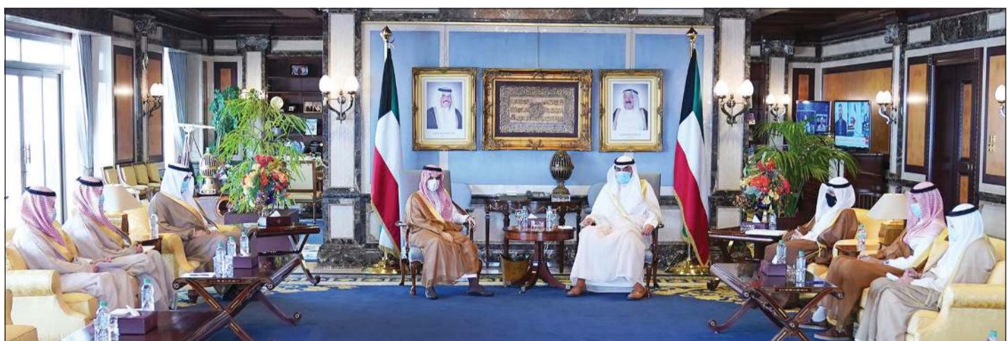
سمو رئيس الوزراء الشيخ صباح الخالد مستقبلا وزير الخارجية السعودي صاحب السمو الأمير فيصل بن فرحان بن عبدالله آل سعود بحضور وزير الخارجية الشيخ د. أحمد ناصر المحمد والسفير الشيخ علي الخالد والسفير ناصر المزين

استقبل سمو رئيس مجلس الوزراء الشيخ صباح الخالد وبحضور وزير الخارجية الشيخ د. أحمد ناصر المحمد في قصر السيف أمس صاحب السمو الأمير فيصل بن فرحان بن عبدالله آل سعود وزير خارجية المملكة العربية السعودية الشقيقة. حضر اللقاء سفير خادم الحرمين الشريفين لدى الكويت سمو سلطان بن سعد آل سعود وسفير الكويت لدى المملكة العربية السعودية الشيخ علي الخالد ومساعد وزير الخارجية لشؤون مجلس التعاون لدول الخليج العربية السفير ناصر المزين. وتسلم سموه خلال اللقاء رسالة خطية من خادم الحرمين الشريفين الملك سلمان بن عبدالعزيز آل سعود إلى أخيه سمو نائب الأمير وولي العهد الشيخ نواف الأحمد، حفظه الله ورعاه. حضر اللقاء سفير خادم الحرمين الشريفين لدى