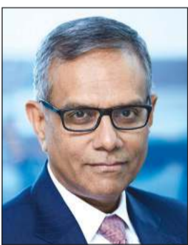
د. راميش راماجاندران

ما أظهر التقرير، إضافة قيمة أكبر للمجموعة، كما مهد الطريق لإحداث نمو مستدام طويل الأجل، كما وضع التقرير أداء «ايكويت» في مجال التنمية المستدامة على مستوى الاقتصاد والبيئة والمجتمع. وبهذه المناسبة، قال الرئيس التنفيذي لمجموعة ايكويت د. راميش راماجاندران، إن المجموعة تتدرك مدى مسؤولياتها على المستوى العالمي والإقليمي والمحلي، بصفتها لاعبا دوليا بارزا في قطاع البترول وكيمويات، مؤكدا التزام «ايكويت» التام بأهداف الأمم المتحدة للتنمية المستدامة كما قال: إننا ننسجم معها في أهداف استراتيجيتنا للتنمية المستدامة، وأضاف: تهدف