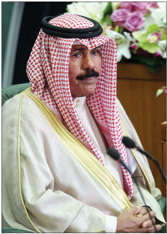
سمو نائب الأمير وولي العهد الشيخ نواف الأحمد

بلادها وما أسفرت عنه من سقوط العديد من الضحايا والمصابين ونزوح الآلاف من مناطقهم، سائلا سموه المولى تعالى أن يتغمد الضحايا بواسع رحمته وراجيا للمصابين سرعة الشفاء والعافية وللنازحين سرعة العودة لمناطقهم وأن يتمكن المسؤولون في البلد الصديق من تجاوز آثار هذه الكارثة الطبيعية.