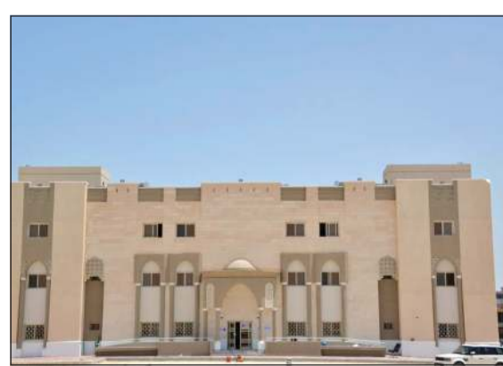
من مباني المدينة

الخاصة بها والتي تشمل مبنى واحدا لتنمية المجتمع، ومبنى وحدة اجتماعية، ومخفر شرطة قيادي، ومبنى مجمع تجاري، ومجمع حكومي، ومبنى فرع غاز وغرفة الحارس له. وتابعت المؤسسة انه تم تشكيل لجان المؤسسة لتسلم مباني عامة في نفس المنطقة خلال شهر سبتمبر الجاري