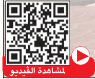
مشاهدة الفيديو (زين غلام)