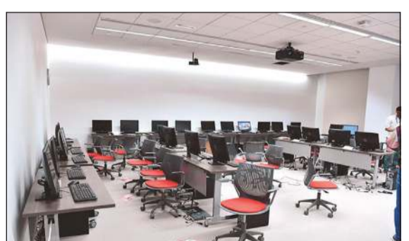
الكلية عقدت دورات لأعضاء هيئة التدريس والطلاب تمهيدا للتعليم الإلكتروني

من الدورات والورش لأعضاء هيئة التدريس والطلاب في فترة لاحقة للتعامل مع منصة «مايكروسوفت» وتم استخدام التكنولوجيا. والتعامل مع هذه المنصة وتم توفير كادر في حال احتياج عضو هيئة التدريس للمساعدة. وأشار إلى أن عضو هيئة التدريس في كلية الآداب يستطيع استخدام مكتبته في الكلية للتدريس من خلاله بوجود الكادر الفني ليتمكن من إعطاء