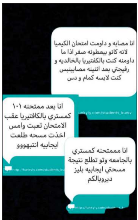
رسائل متداولة لعدد من الطالبات توضح إصابتين بـ«كورونا».

انتشر خلال الساعات الماضية هاشتاغ على تويتز بعنوان «#كلية العلوم تنشر كورونا»، حذر من خلاله الطلبة من انتشار فيروس كورونا بجامعة الكويت بعد تأكيد إصابة عدد من طلبة الكلية بالفيروس.