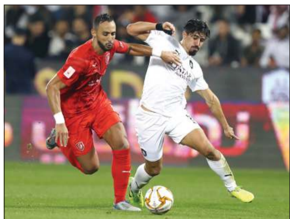
السيد يهدد مشاركة الدحيل في مونديال الأندية

أعلن الاتحاد القطري لكرة القدم عن استعداده لاستقبال الأندية المشاركة في النسخة الحالية من بطولة دوري أبطال آسيا لكرة القدم 2020. اعتباراً من 10 سبتمبر المقبل، وجاء ذلك بعد تنسيقه مع الاتحاد الآسيوي للوقوف على أنسب تواريخ المواعيد لاقدم الفرق إلى الدوحة لاستكمال مباريات أندية غرب آسيا للبطولة الآسيوية والتي تشهد مشاركة 16 فريقاً لخوض غمار دور المجموعات والتي تنطلق 14 سبتمبر المقبل، وذلك بعد أن وقع اختيار الاتحاد الآسيوي على دولة قطر لاستضافة مباريات دوري الأبطال لمنطقة غرب آسيا بنظام التجمع، بعدما توقعت أسياقة بسبب أزمة تفشي فيروس كورونا المستجد. وحدد الاتحاد الآسيوي اليوم كآخر موعد لغلغلق باب تقديم القوائم الخاصة