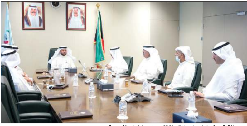
وزير المالية براك الشيستان خلال لقائه مجلس إدارة «الكويتية»

وتطوير الناقل الوطني للكويت، وذلك بعد أن أصدر الوزير قرارا وزاريا رقم 38 لسنة 2020 بتاريخ 27 أغسطس 2020 لإعادة تشكيل مجلس إدارة الخطوط الجوية الكويتية.