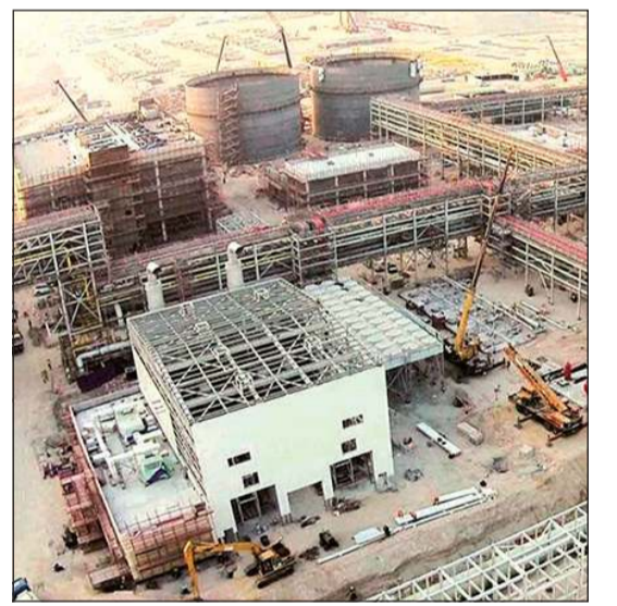
محطة شمال الزور أحد مشاريع الشراكة

قالت مجلة ميد إنه يجري في الوقت الحاضر تقييم العطاءات الاستثمارية لمشروعات عملاقة مستقلة للطاقة والمياه المقرر تنفيذها بالشراكة بين القطاعين العام والخاص، بعد محاولتين فاشلتين من هذا القبيل. وأضافت المجلة أن إدراج شركة شمال الزور الأولى للطاقة والمياه للتداول في بورصة الكويت في 16 أغسطس قد يكون باكورة المشروعات المستقلة للطاقة والمياه في البلاد، وفقا للتصور الوارد ضمن الإطار التنظيمي.