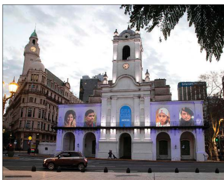
صور لعاملين في الصفوف الامامية ضد «كورونا» على واجهة متحف كابيلو الشهير في بوينس آيرس

عواصم - وكالات: بمعدل مليون حالة جديدة كل أربعة أيام منذ أكثر من شهر ونصف، تتجاوز عدد الإصابات بفيروس كورونا المستجد المؤكدة حول العالم، حاجز الـ 25 مليوناً ونحو 100 ألف إصابة. ووفقاً لبيانات منظمة الصحة العالمية، فإن العدد الرسمي لحالات الإصابة العالمية يزيد الآن خمس مرات عن عدد حالات الإنفلونزا الحادة المسجلة سنوياً. من جهته، أعلن معهد أبحاث الليولوجيا الجزيئية ومقره جاكارتا أمس، رصد سلالة متحورة أكثر عدوى من الفيروس في إندونيسيا في وقت تشهد فيه البلاد ارتفاعاً في عدد الحالات. وقالت هيرواتي سودويو نائبة مدير المعهد لـ «رويترز» إن الطفرة «دي 614 جي من الفيروس»، «المعدية لكن الأضعف تأثيراً»، وجدت في بيانات تسلسل الجينوم بعينات جمعتها المعهد، مضيفة أن هناك حاجة لمزيد من الدراسة لتحديد ما إذا كانت الطفرة هي سبب ارتفاع الحالات في الأونة الأخيرة. التفاصيل ص 20