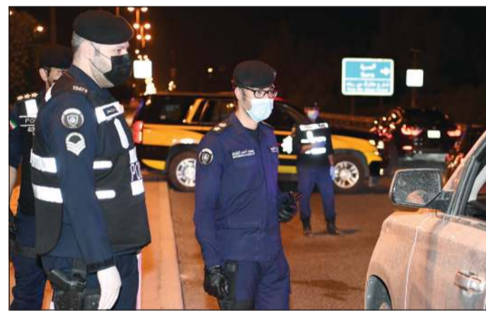
رجال «الداخلية»، لم يترددوا في القيام بأهمهم الكبيرة خلال جائحة «كورونا»

3864 ساعة أو 161 يوم عمل متواصل قضاه رجال «الداخلية» في العمل لخدمة المواطنين والمقيمين في أزمة فيروس كورونا، لم يملوا ولم يكفوا، بل عملوا في أصعب الظروف، ومع درجات الحرارة العالوية، ومرت عليهم مناسبات عدة وهم يعيدون عن الأهل في شهر رمضان والأعياد وغيرها. قاموا بواجبهم على أكمل وجه في دعم السلطات الصحية في البلاد ومساندتها لمواجهة الفيروس وحماية الجميع، ولم يترددوا لحظة في تقديم الواجب بل مستمرين. ومع قرار انتهاء الحظر في البلاد، نقول لرجال الداخلية «كفيتوا ووفيتوا ورايتكم بيضا».