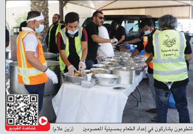
المتطوعون يشاركون في إعداد الطعام بحسينية العصمين (زين علام) | مشاركة الفيديو

الحسينيات ومجالس الذكر أقامت عزاء الحسين وآل بيته وأصحابه عليهم السلام