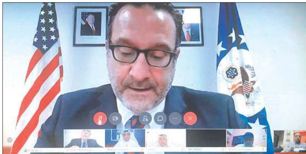
مساعد وزير الخارجية الأميركية لشؤون الشرق الأدنى ديفيد شينكر خلال المؤتمر الصحفي مع عدد من ممثلي وسائل الإعلام المحلية