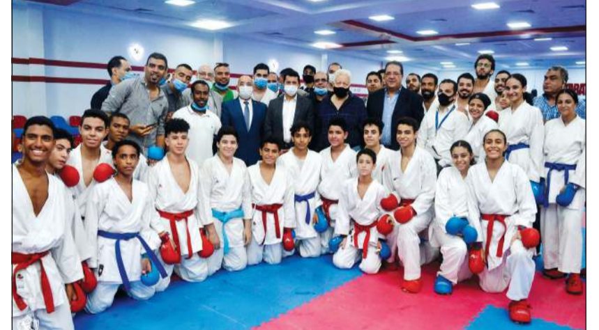
د. أشرف صبحي والمستشار مرتضى منصور ومجلس إدارة النادي خلال افتتاح منشآت النادي الجديدة