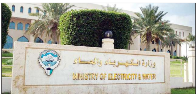
مبنى وزارة الكهرباء والماء