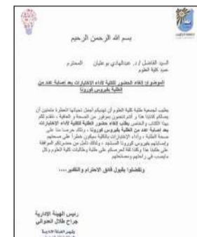
صورة من الكتاب الرسمي