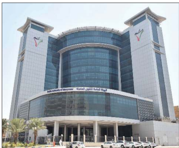
الهيئة العامة للقوى العاملة