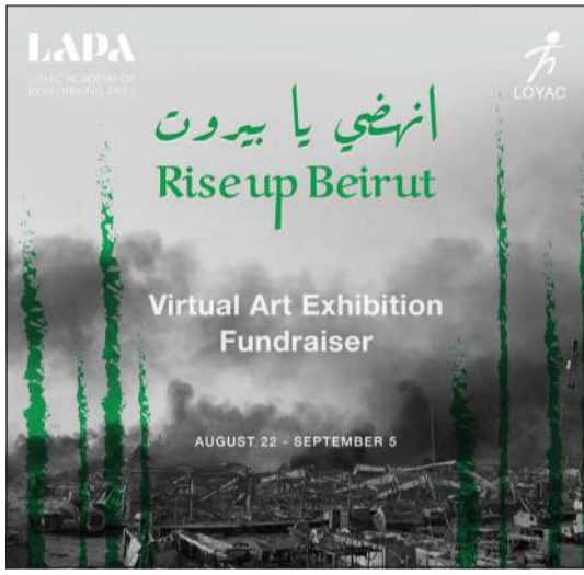
شعار المعرض الفني «انهضي يا بيروت»