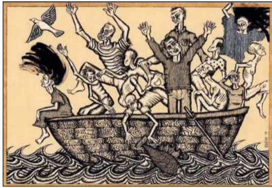
عمر القيسي من العراق - الشمس