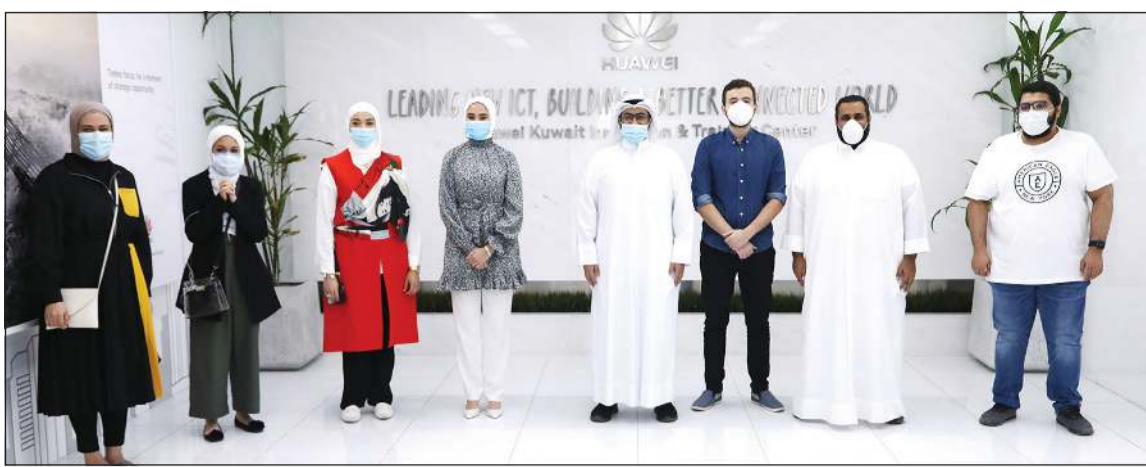
لقطة تذكارية مع عدد من المشاركين بالمسابقة