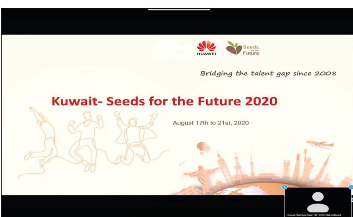
«هاواي» نظمت مسابقة تكنولوجيا المعلومات

قامت شركة هاواي الكويت بتنظيم مسابقة لتكنولوجيا المعلومات والاتصالات بمشاركة العديد من الجامعات منها: 1 - كلية الكويت للعلوم والتكنولوجيا (KCST) 2 - University of Liverpool 3 - Northern Arizona University 4 - City University London 5 - ACK 6 - AUM 7 - University of San Diego 8 - Kuwait University