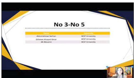
من أسماء الفائزين