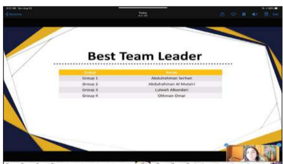
أفضل قائد فريق