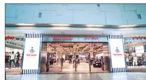
متجر «فوت لوكر» الجديد في الأقنيوز

عملاء محسنة من خلال مساحة تنشط. وقال فيجاي تالوار، نائب الرئيس التنفيذي والمدير التنفيذي لشركة فوت لوكر في الشرق الأوسط: «بتمثل هدفنا في خلق ثقافة جديدة يسودها الإثارة والابتكار في مجال الأحذية الرياضية المجتمعات المحلية فضلاً عن تعزيز تجربة التسوق داخل المتجر في ظل حرصنا على إلهام وتمكين الشباب».