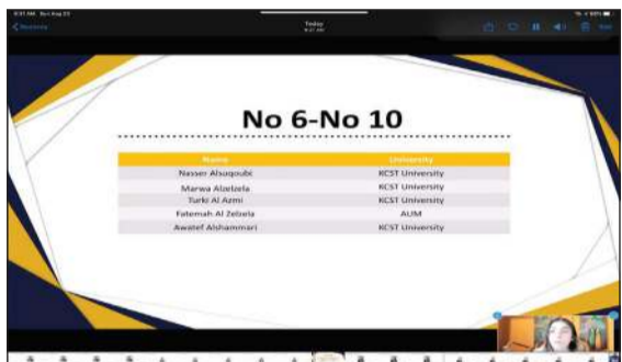
أسماء عدد من الفائزين بالمسابقة