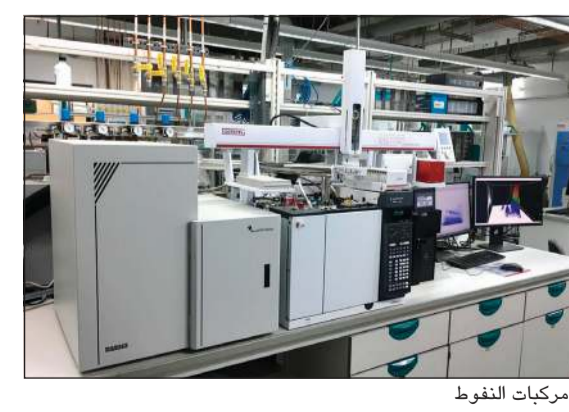
من مختبر علوم فصل مركبات النفوط

ان الدراسات التي اجراها المختبر اثبتت ان كميات الكبريت ليست المقياس المطلق في تحديد صعوبة التكرير هذا النفط أو ذاك انما نوعية المركبات الموجودة في النفط الخام هي التي تؤثر على كفاءة تكرير النفوط. ولفت الى ان الكويت قطعت شوطاً كبيراً في تحسين نوعية الديزل في انتاجها لتسويقه الى البلاد الاشتراطات البيئية المشددة، مشيراً الى ان القيود البيئية على الديزل باتت صارمة جداً من حيث تخفيض معدلات الكبريت فيه، وبالتالي تحاول المصافي الوصول الى هذه المعدلات لتسويقها الى الدول التي