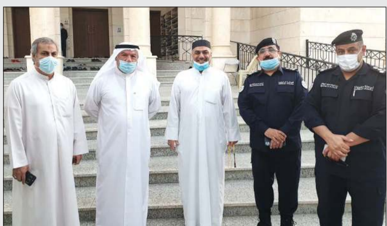
الواء محمود بوشهري والعميد خالد الكندري خلال الجولة

قام محافظ مبارك الكبير اللواء محمود بوشهري برفقة مدير عام مديرية أمن محافظة مبارك الكبير العميد خالد الكندري مساء أول من أمس بزيارة تفقدية إلى عدد من الحسينيات ومجالس العزاء في عدد من مناطق المحافظة وذلك للاطمئنان على استعدادات الحسينيات والوقوف على الإجراءات الصحية والإطلاع على خطط تأمينها خلال شهر محرم الجاري. وقد اطلع بوشهري على كل الإجراءات الاحترازية والوقائية في مواجهة فيروس كورونا المستجد في الحسينيات، وذلك بما يضمن ممارسة روادها للشعائر في أجواء من السكينة والطمأنينة والتقي المحافظ ببعض اصحاب ورواد