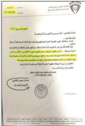
كتاب الاتحاد بخصوص المراسلات الرسمية