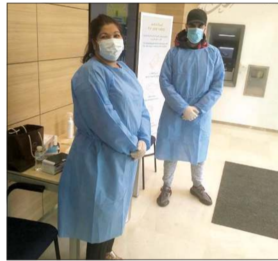
متطوعان من البنك الأهلي المتحد في خدمة العملاء