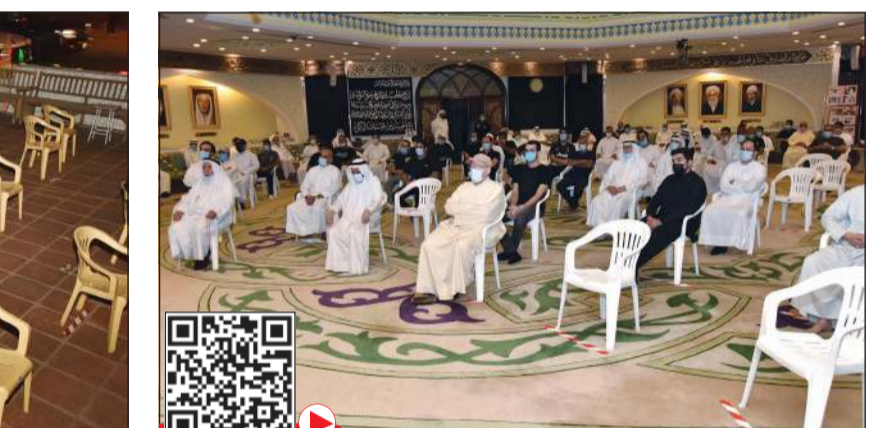
الحفاظ على التباعد بين المعزين في حسينية الشيخ الأوجد