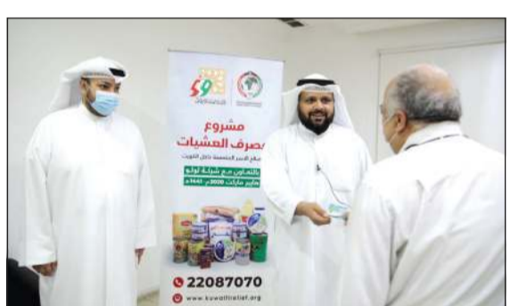
السحب يقدم كوبون مصرف العشيات لأحد المستفيدين