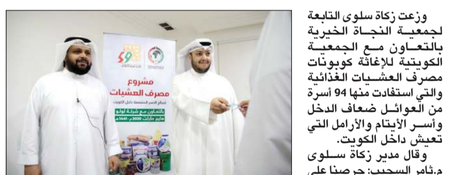
العبيد يوزع كوبونات العشيات

العشيات بعد حلقة من حلقات التعاون المميز بين النجاة الخيرية والجمعية الكويتية للإغاثة، ويتم دعم المشروع من قبل الأمانة العامة للأوقاف، وبين العبيد أن المصرف مخصص لصالح مشروع المواد الغذائية تنفيذاً لتعليمات الجهة الداعمة للمشروع، وأوضح أن القيمة