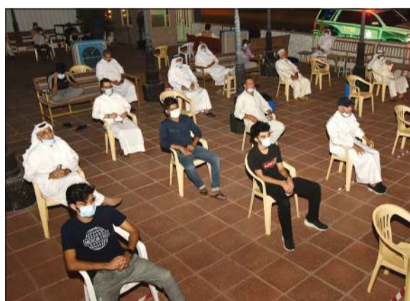
الزام من الحضور بالاشتراطات الوقائية في مجالس العزاء

لقد أراد سمو نائب الأمير وولي العهد الأمين الشيخ نواف الأحمد من خلال كلمته البيعة، أن يرسم لنا خارطة طريق تعالج المشاكل وتطبق القانون على كل مخطئ بحق وطنه وخائن للأمانة بحجج زائفة ومظاهر مدلسة وبشرنا بأنهم لن يفلتوا من العقاب إن شاء الله.