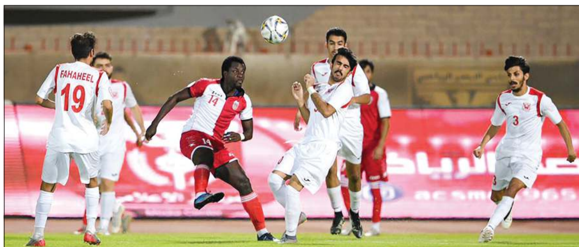
هل تستمر صراحة الفحيحيل بعد الفوز على الصليبخات في الجولة الماضية؟

وتقام المباراتان في توقيت واحد الـ 6:55 ويغيب عن منافسات الجولة فريق خيطان برصيد 15 نقطة، وكان الجهراء قد حسم موقفه مبكراً من الفوز بلقب المسابقة ليبقى الصراع حول مركز الوصافة حاداً بين الفرق الأربعة نظراً للتقارب في النقاط، ونجح الفحيحيل الجولة الماضية في