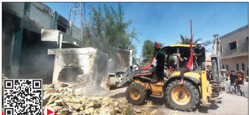
مظاهرات عراقيون يهدمون مكتبا تابعا لأحد الأحزاب بالجرافة

عواصم - وكالات: احتشد آلاف المتظاهرين العراقيين امس في ساحة الاعتصام وسط الناصرية مركز محافظة ذي قار رافعين اصواتهم مجددا ومددبين بعمليات القتل والترهيب التي طالت ناشطين سياسيين. وقام المتظاهرون بإحراق الإطارات احتجاجا على عمليات القتل التي عمت المدينة، حيث لم يرهبهم الترهيب والوعيد عن رفع الصوت لتنفيذ مطالبهم، وعلى رأسها التحقيق في مسلسل الاغتيالات. وهدم المتظاهرون جميع مقر الفصائل الموالية ليران في ذي قار، حيث دمروا مقر حزب الدعوة بزعامة نوري المالكي، ومقر عسكري تابع لعصائب أهل الحق بزعامة قيس الخزعلي، ومقر منظمة بدر بزعامة هادي الحكيم، ومقر الحزب الشيوعي، ومنزل جبار الموسوي القيادي في حزب الله العراقي. إلى ذلك، أحرق المحتجون مكاتب منظمة بدر وحزب الدعوة ومقرات أحزاب أخرى موالية لإيران.