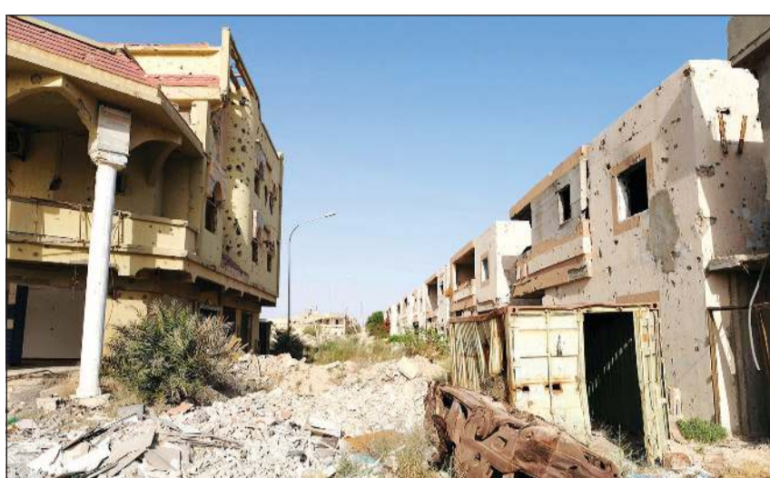
مبان مهتمة في مدينة سرت جراء القتال ضد مسلحي «داعش» (رويترز)

دوليا، دعا الأمين العام للأمم المتحدة أنطونيو غوتيريس أطراف النزاع في ليبيا للانخراط بشكل بناء في عملية سياسية شاملة تستند إلى نتائج مؤتمر برلين وقرار مجلس الأمن رقم 2510. وكان المجلس الرئاسي لحكومة الوفاق الليبية برئاسة فائز السراج ومجلس برئاسة المستشار عقيلة صالح، قد أعلن أمس الأول، وقف إطلاق النار في أنحاء الأراضي الليبية كافة، مع وقف أي عمليات قتالية وعسكرية وجعل (سرت) و(الجفرة) منطقتين منزوعتي السلاح.