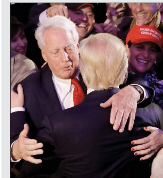
روبرت الشقيق الأصغر لترامب مهتماً بآية فوزه في الانتخابات الرئاسية في نوفمبر 2016

«نيويورك تايمز» إن «محاولتها إثارة التشويق وإساءة وصف علاقتنا العائلية بعد كل هذه السنوات، لتحقيق مكاسب مالية خاصة بها، هي مهزلة وظلم لنذكر أخي الراحل فريد ووالدينا المحبوبين». وأضاف «أنا وبقية أفراد عائلتي فخورون جداً بأخي الراحل، الرئيس»، معتبراً أن «تصرفات ماري هي وصمة عار».