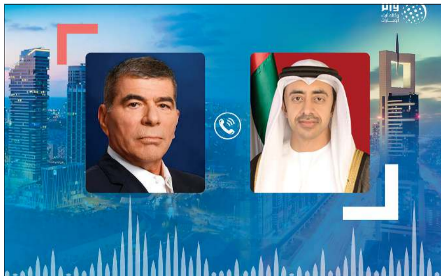
صورة تشترتها وكالة الأنباء الإماراتية للشيخ عبدالله بن زايد وزير الخارجية والتعاون الدولي وغابي أشكنازي وزير خارجية إسرائيل

ساديف: «يسرنا التعاون مع شركة أبليكس الوطنية للاستثمار ونأمل أن نحقق من هذا التعاون الأهداف المنشودة والتي تعود بالمنفعة الاقتصادية على الجميع خصوصاً في هذه الظروف الاستثنائية مع انتشار فيروس كورونا المستجد في مختلف أنحاء دول العالم». ويهدف الاتفاق بين الشركتين إلى تطوير وتعزيز الأبحاث والدراسات الخاصة بفيروس كورونا إضافة إلى تطوير جهاز فحص كورونا للمساهمة في تسريع عملية الفحص وتسهيله وتوفيرها بدرجة عالية لجميع أفراد المجتمع وفق أفضل الممارسات العالمية.