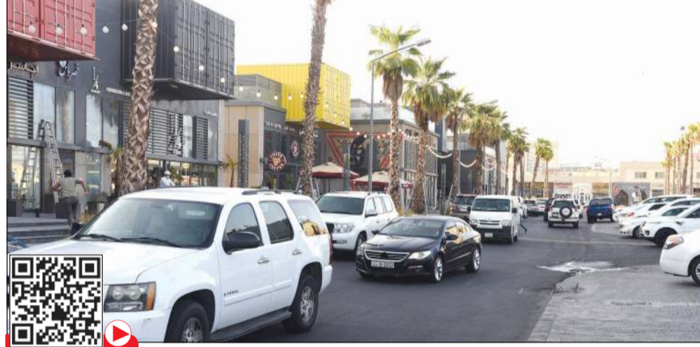
المقاهي والمطاعم تستعد لاستقبال روادها بمنطقة العارضية