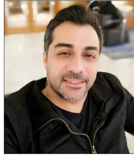
الشاعر عماد الأسعد