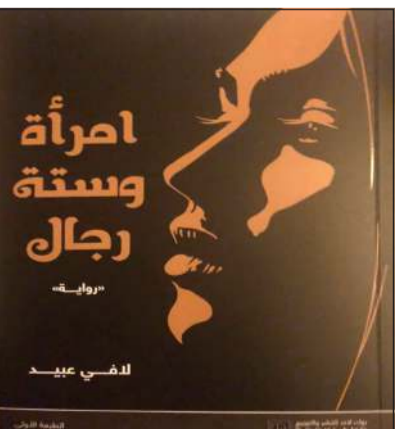
بوستر رواية «امرأة وستة رجال»