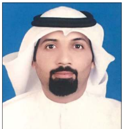
الروائي لافي عبيد