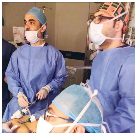
الفريق الطبي خلال إجراء العملية