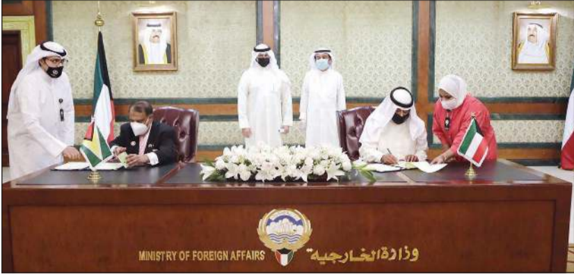
جانب من توقيع الاتفاقية بين الكويت وغايانا

الكويت وجمهورية غايانا الاتحادية بشأن الإعفاء المتبادل لتأشيرة الدخول المسبقة لحملة الجوازات الدبلوماسية والخاصة بالخدمة. وقالت وزارة الخارجية في بيان أنه تم توقيع الاتفاقية عن الجانب الكويتي نائب وزير الخارجية خالد الجار الله وعن جانب غايانا سفير جمهورية غايانا التعاونية لدى الكويت السفير د. شمير علي. وحضر مراسم التوقيع مساعد وزير الخارجية لشؤون المراسم السفير ضاري العجران ومساعد وزير الخارجية لشؤون مكتب نائب الوزير السفير أيهم العمر.