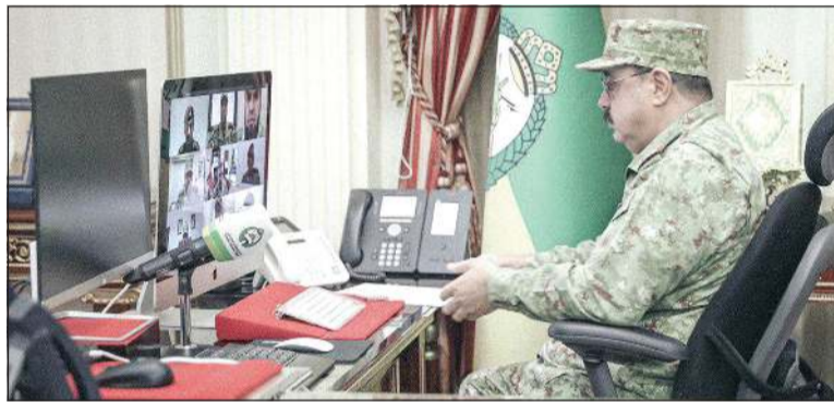
الفريق الركن م.هاشم الرفاعي خلال الاتصال المرئي مع المشاركين بالدورة

مع إخوانهم من ضباط الحرس الوطني، تجسيدا للتعاون وتبادل الخبرات وتحسين التكامل بين الأشقاء. وأشار الرفاعي إلى أن القيادة العليا في الحرس الوطني تولي أهمية كبيرة لاستمرار العملية التعليمية والتدريبية باستخدام التقنيات التعليمية الحديثة ليواصل رجال الحرس الوطني مهامهم في حماية أمن الوطن واستقراره بالتعاون مع زملاء السلاح في الجيش والشرطة والإدارة العامة للإطفاء.