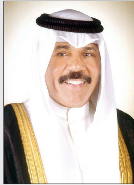
سمو نائب الأمير وولي العهد الشيخ نواف الأحمد

سموه هنا الرئيس الإكوادوري بالعيد الوطني..وعزى رئيس الهند في ضحايا انهيار ولاية كيرالا