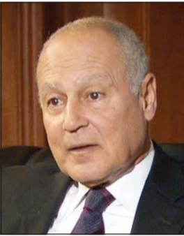
أحمد أبو الغيط

عربية. وأوضح أبو الغيط أن الإعلام يعد صناعة مهمة في تشكيل وعي المجتمعات وصياغة الرأي العام بشكل عام، في حين يقوم إعلام اليوم على التدفق المعلوماتي من مصادر متعددة، وهذه معادلة صعبة لجهة الحفاظ على الأمن العام وحماية الجماهير من الشائعات مع الحفاظ على قدر من الانفتاح الرقمي نظراً إلى ما يحويه من فرص مهمة. واعتبر الإعلام الصادق درعا لأمن للوطن والمواطنين خاصة في ضوء الانفتاح الرقمي الذي جعل أفراد المجتمعات عرضة إلى رسائل تتضمن الحقائق والتضليل وسط «نوايا لتخريب المجتمعات».