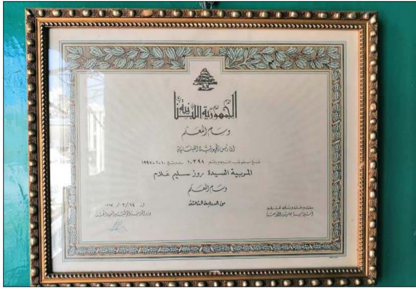
وسام المعلم الحاصلة عليه روز بموجب المرسوم الاشتراعي رقم 10398