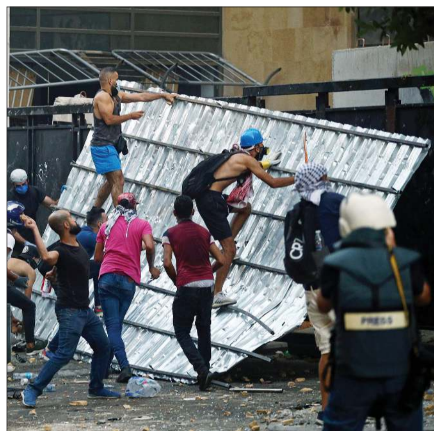
المحتجون اللبنانيون يعبرون عن غضبهم اليوم الثاني على التوالي