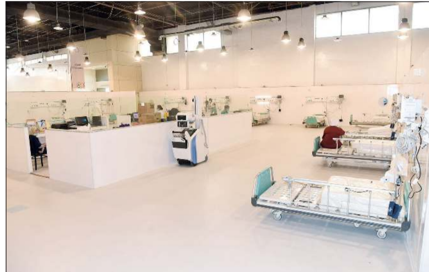
مستشفى الكويت الميداني يشتمل على أحدث التجهيزات الطبية

وتضمنت الآلية انه فيما يخص أقسام الجراحة