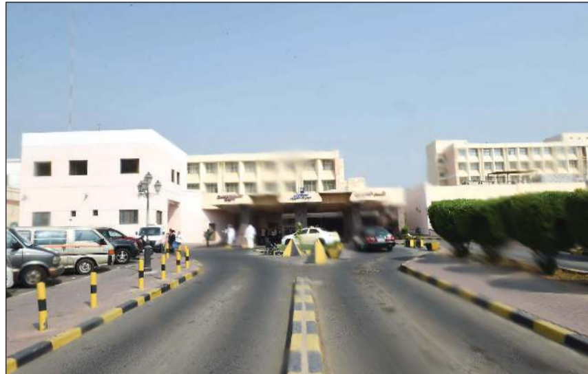
مستشفى مبارك يغطي تخصصات الباطنية والأوعية الدموية

العامة والمسالك البولية وجراحة الحروق والتجميل والعظام والعيون والأنف والأذن والحنجرة والأسنان والجلدية، فيقوم الفريق الطبي الاستشاري بتغطية الاستشارات الخاصة بمستشفى الكويت الميداني